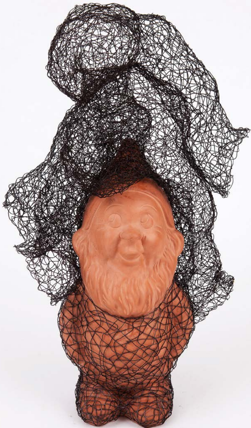
Rémy Samuz, Nain , 2016. Fil de fer et terre cuite, 73 x 46 x 32 cm.