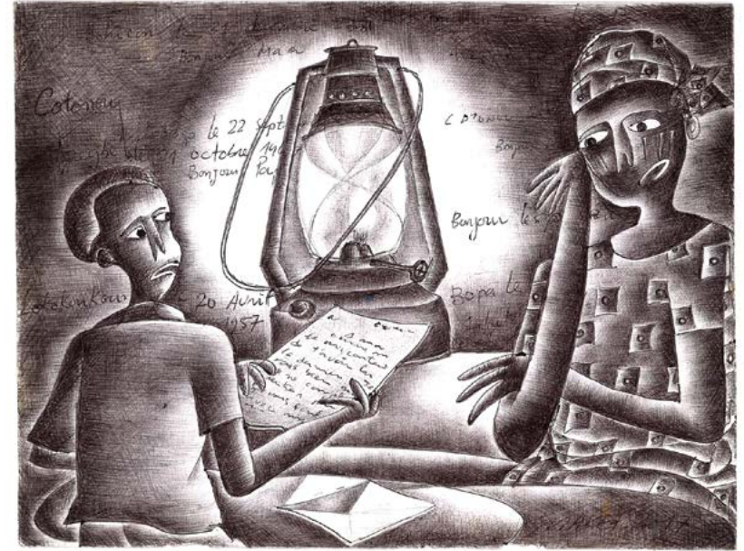
Makef, La lettre , 2017. Stylo à bille sur feuille de cahier d'écolier, 28,5 x 22,8 cm.