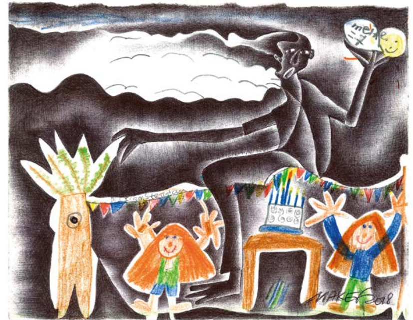
Makef, Sans titre , 2018. Stylo à bille sur feuille de cahier d'écolier, 28,5 x 22,8 cm.