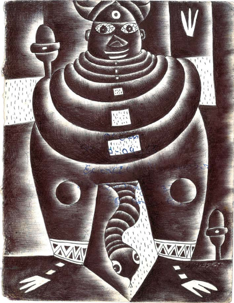
Makef, Edou Baba , 2017. Stylo à bille sur feuille de cahier d'écolier, 28,5 x 22,8 cm.