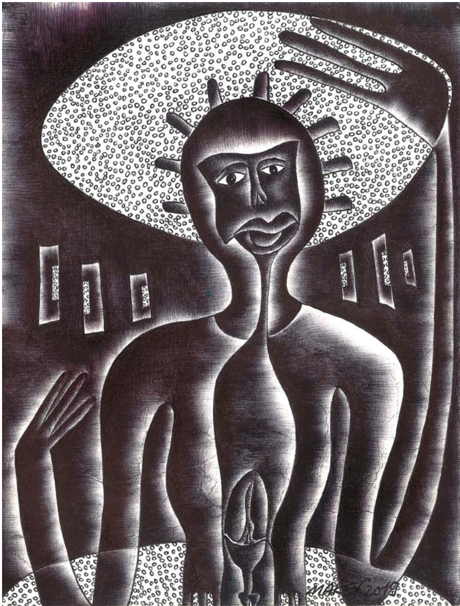
La force intérieure , 2019. Stylo à bille sur feuille de cahier d'écolier, 22 x 16,5 cm.