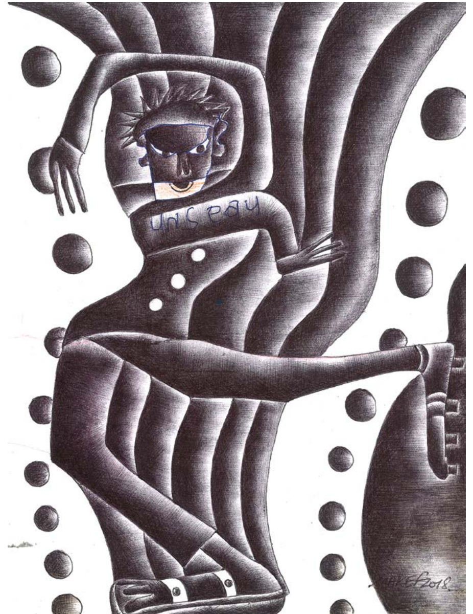
Le jongleur au visage de seu d'eau , 2018. Stylo à bille sur feuille de cahier d'écolier, 22 x 16,5 cm.