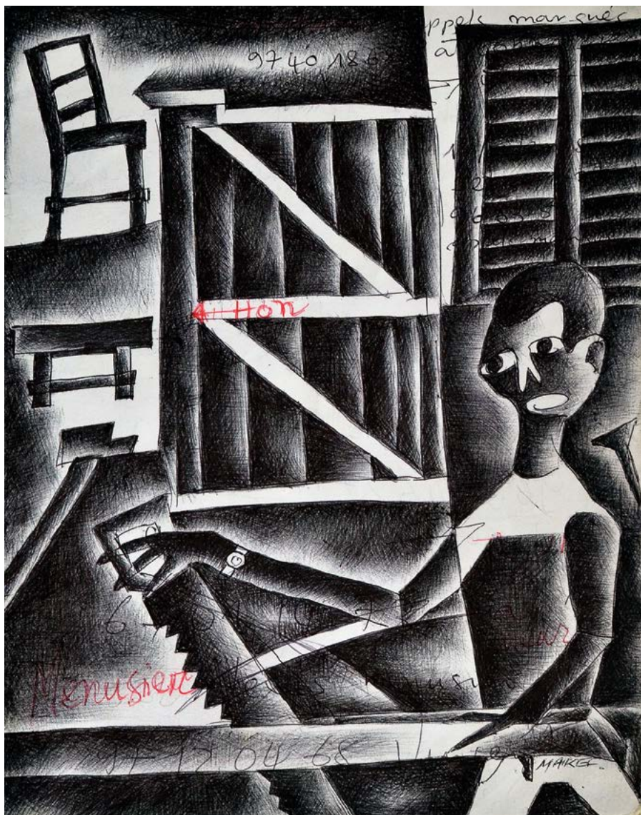
Le menuisier , 2015. Stylo à bille sur feuille de cahier d'écolier, 28,5 x 23 cm.