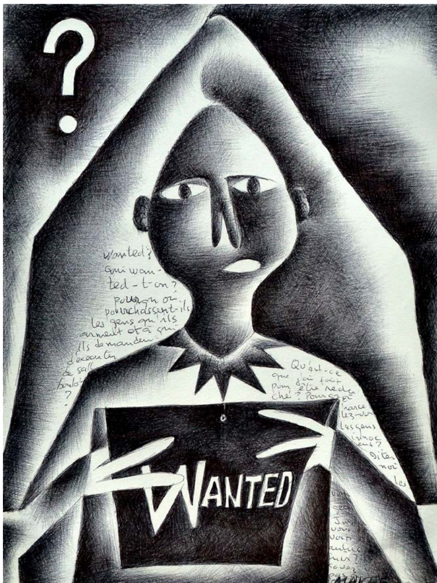
Wanted , 2015. Stylo à bille sur feuille de cahier d'écolier, 28,5 x 23 cm.