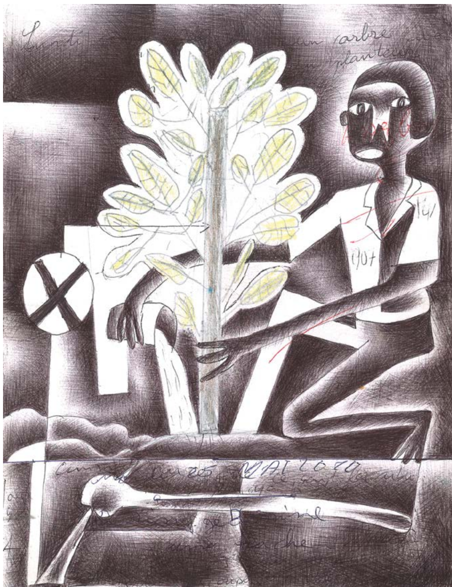
Il n'a pas vécu inutilement , 2015. Stylo à bille sur feuille de cahier d'écolier, 28,5 x 23 cm.