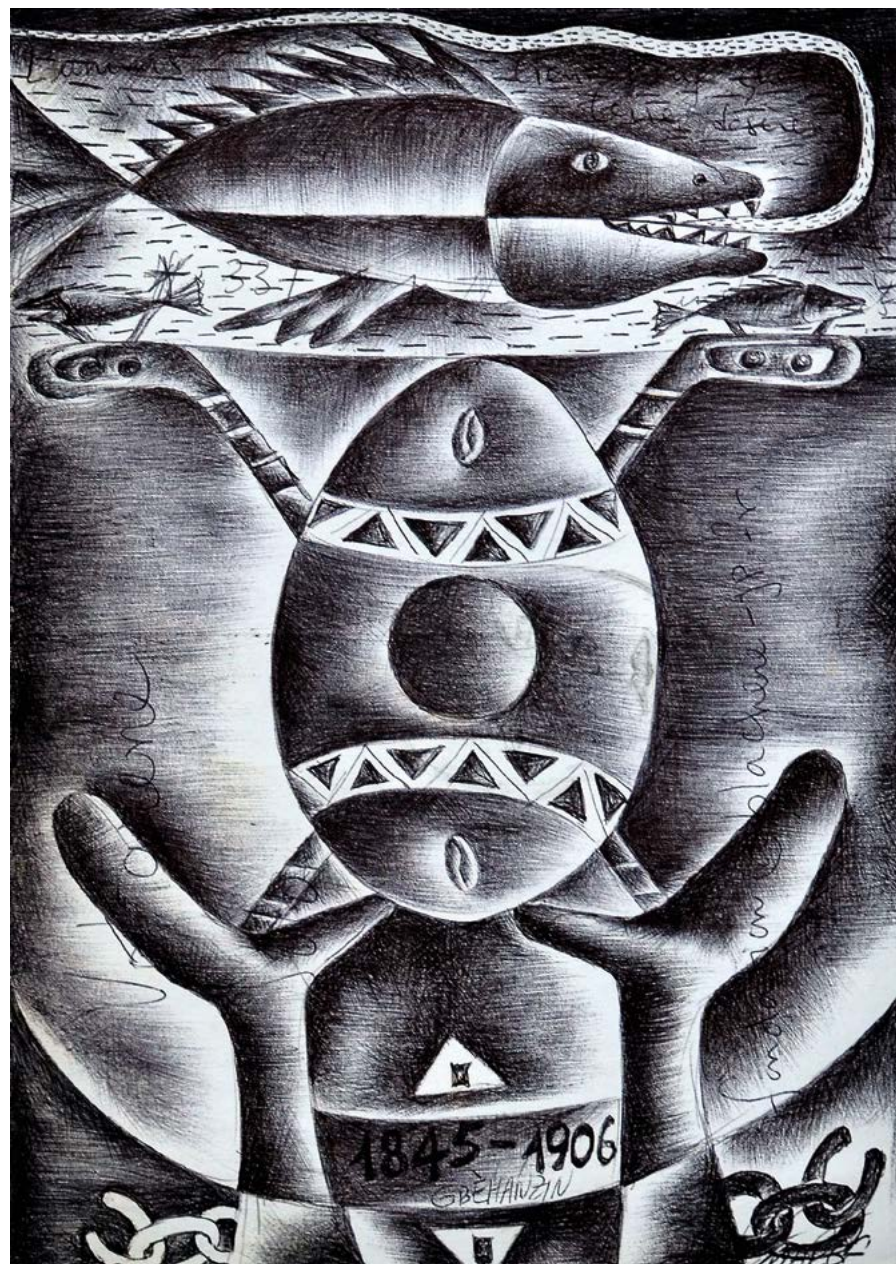
Gbè Hin Azin, 2014. Stylo à bille sur feuille de cahier d'écolier, 28,5 x 23 cm.