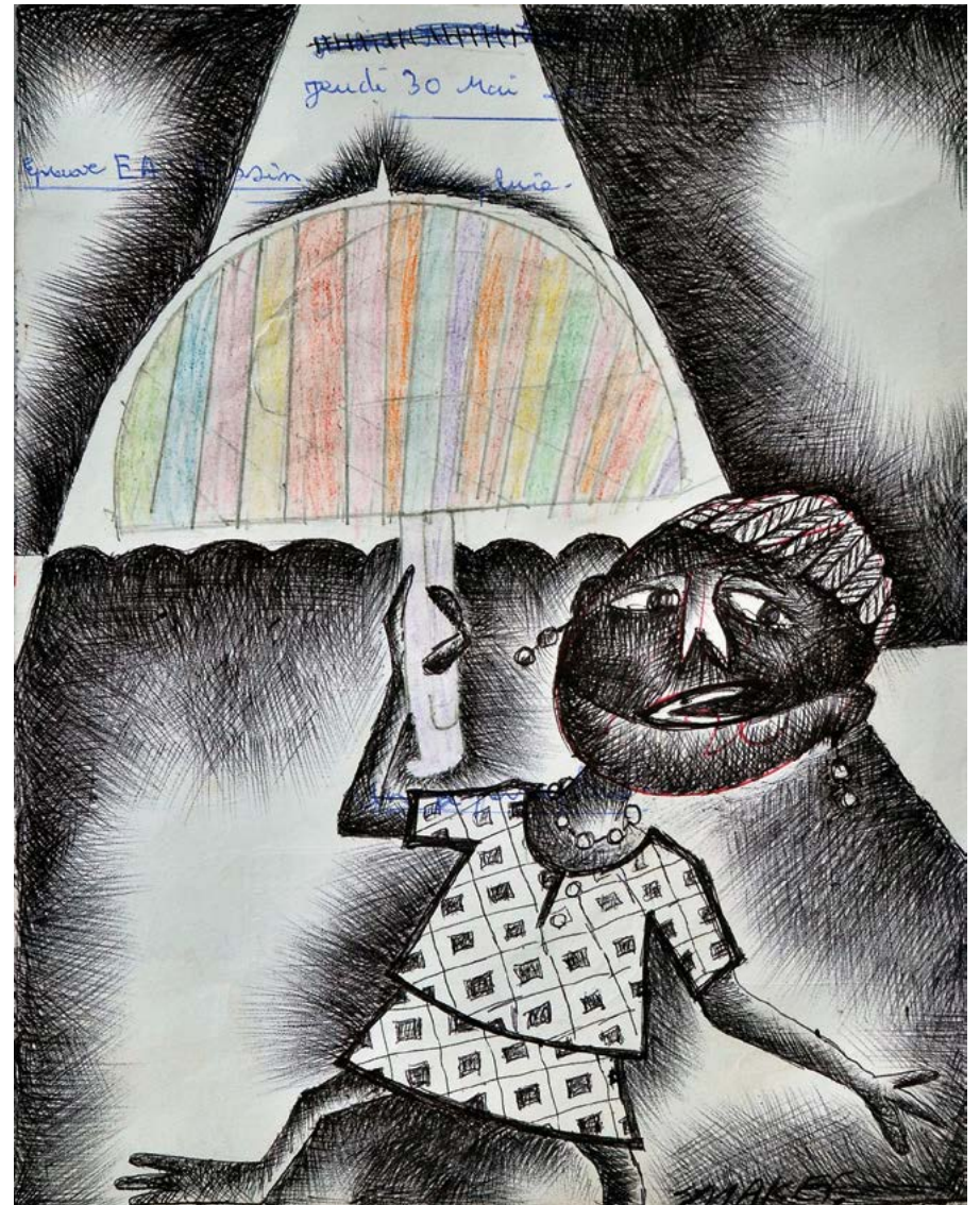
La petite au parapluie , 2014. Stylo à bille sur feuille de cahier d'écolier, 28,5 x 23 cm.