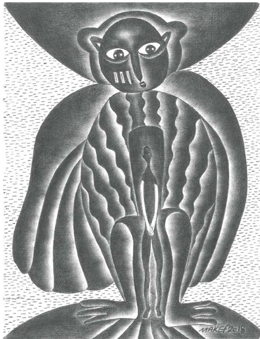
L'homme oiseau , 2018. Stylo à bille sur feuille de cahier d'écolier, 22 x 16,5 cm.