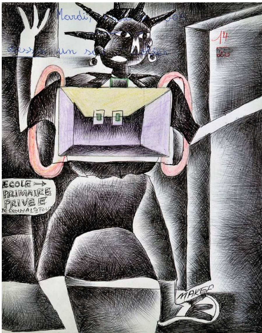
Pour le bien de la société , 2014. Stylo à bille sur feuille de cahier d'écolier, 28,5 x 23 cm.