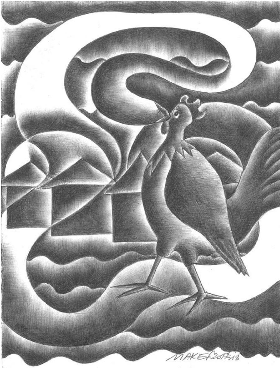
Le coq a un propriétaire mais il chante pour tout le village , 2017-2018. Stylo à bille sur feuille de cahier d'écolier, 22 x 16,5 cm.