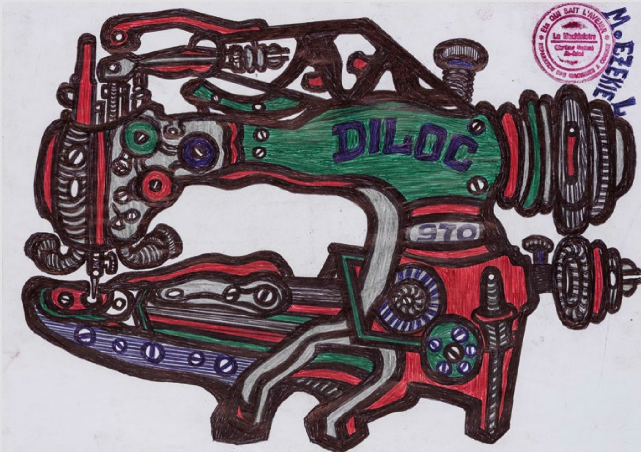
Sans titre (machine à coudre DILOC), Circa 2020. Mine graphite et stylo à bille sur papier, 21 x 29,5 cm.