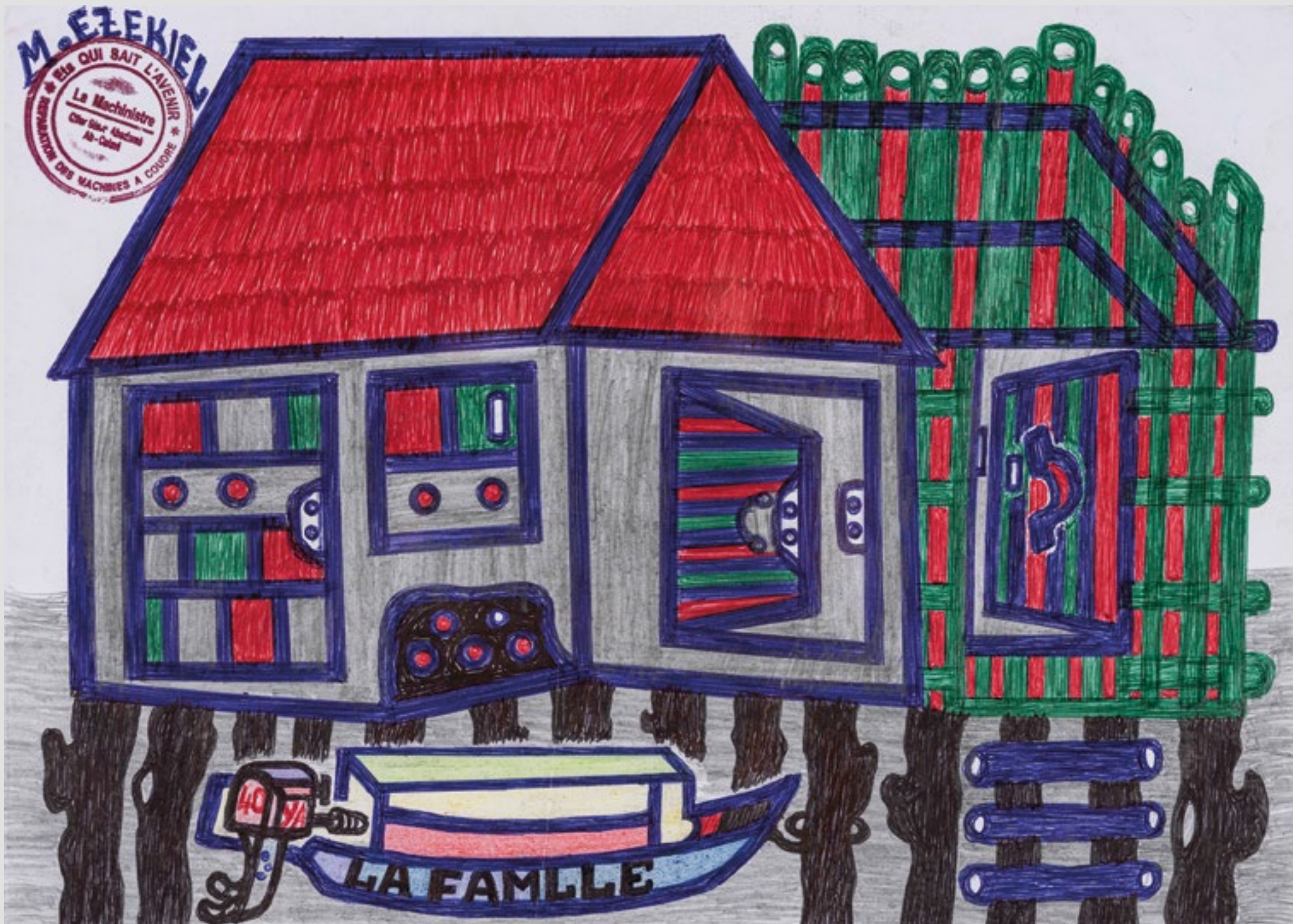
Sans titre (série Ganviè), Circa 2020. Mine graphite et stylo à bille sur papier, 21 x 29,5 cm.