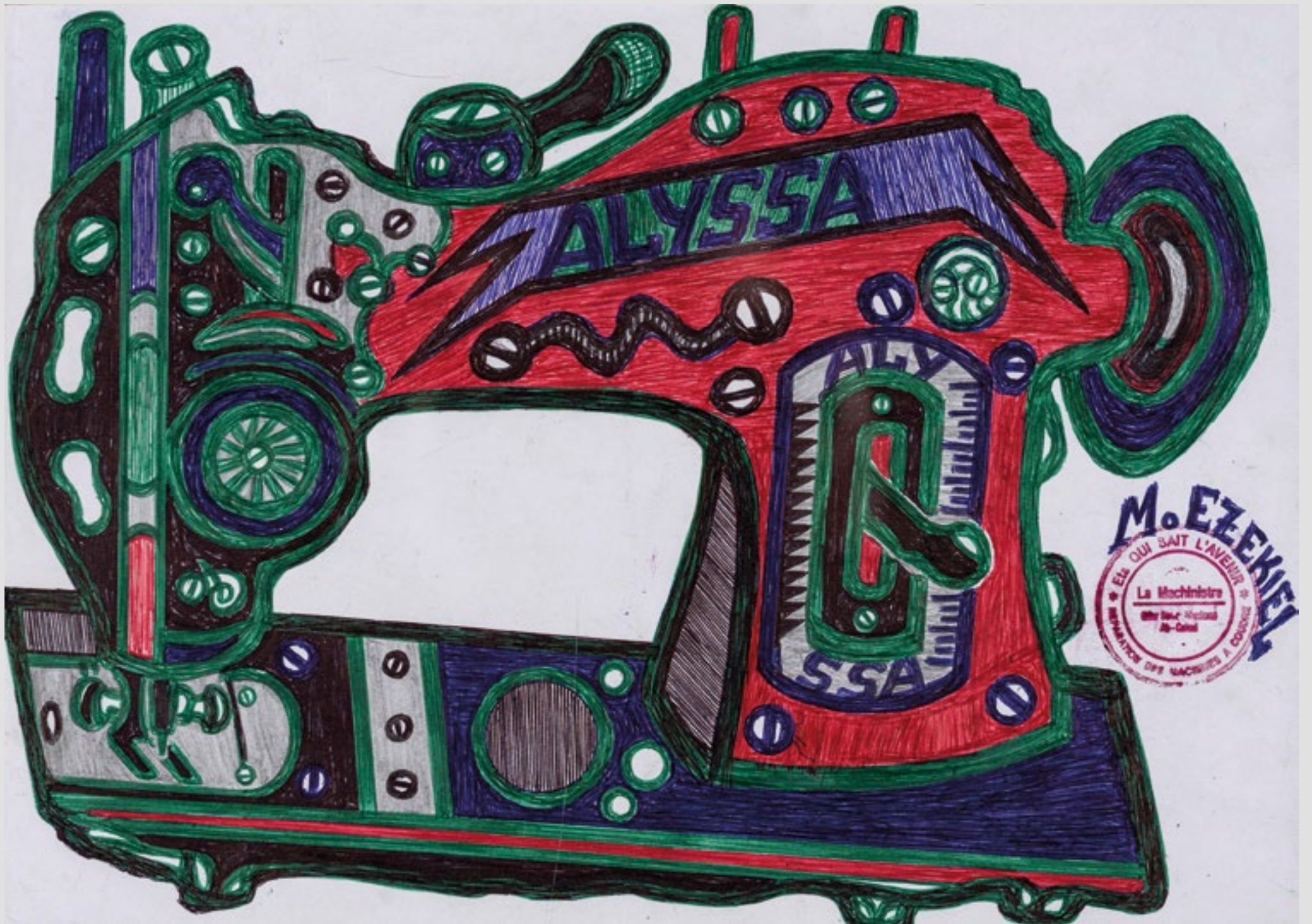
Sans titre (machine à coudre ALYSSA), Circa 2020. Mine graphite et stylo à bille sur papier, 21 x 29,5 cm.