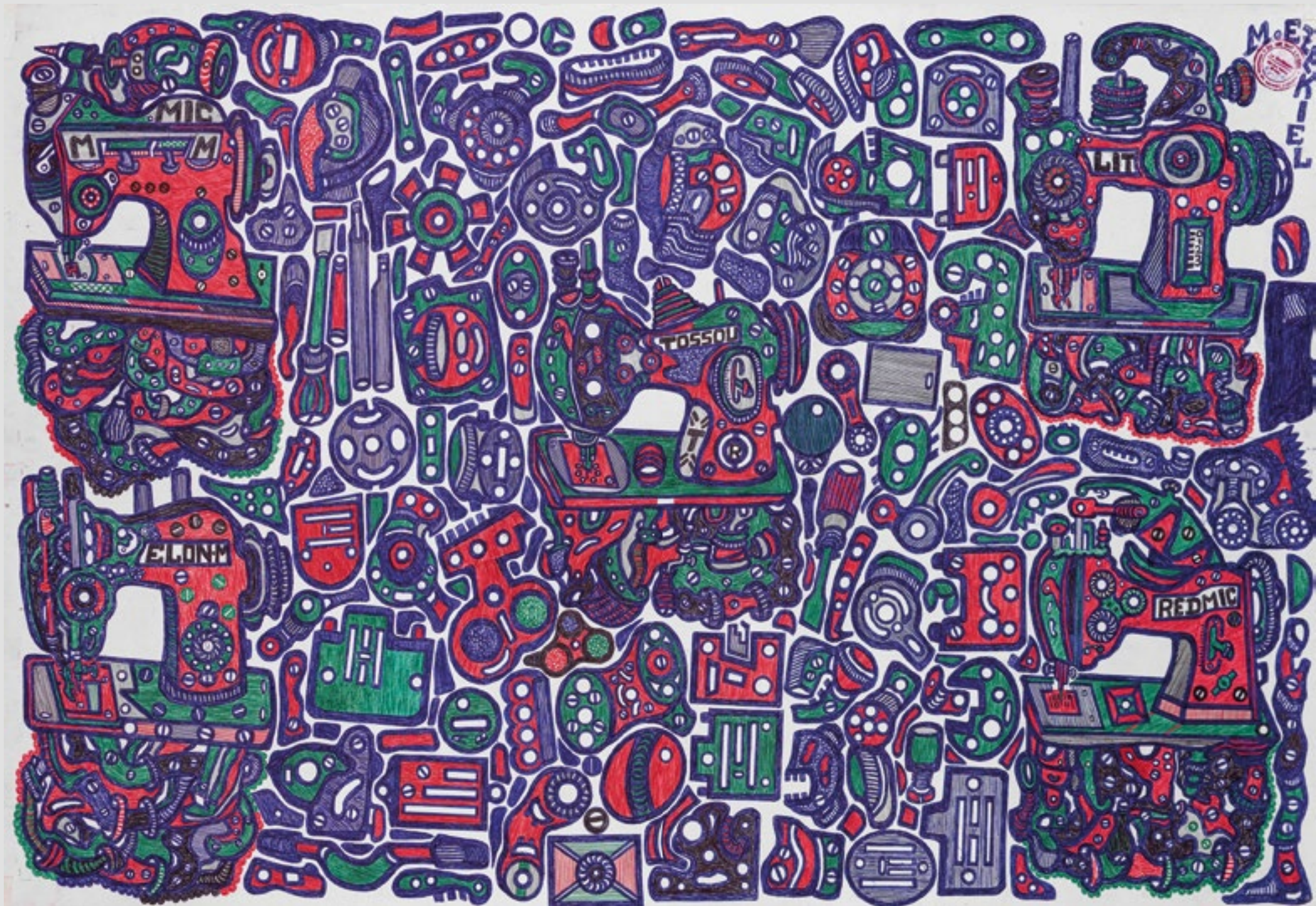
Sans titre (machine à coudre SINGER), Circa 2020. Mine graphite et stylo à bille sur papier, 65,5 x 100 cm.