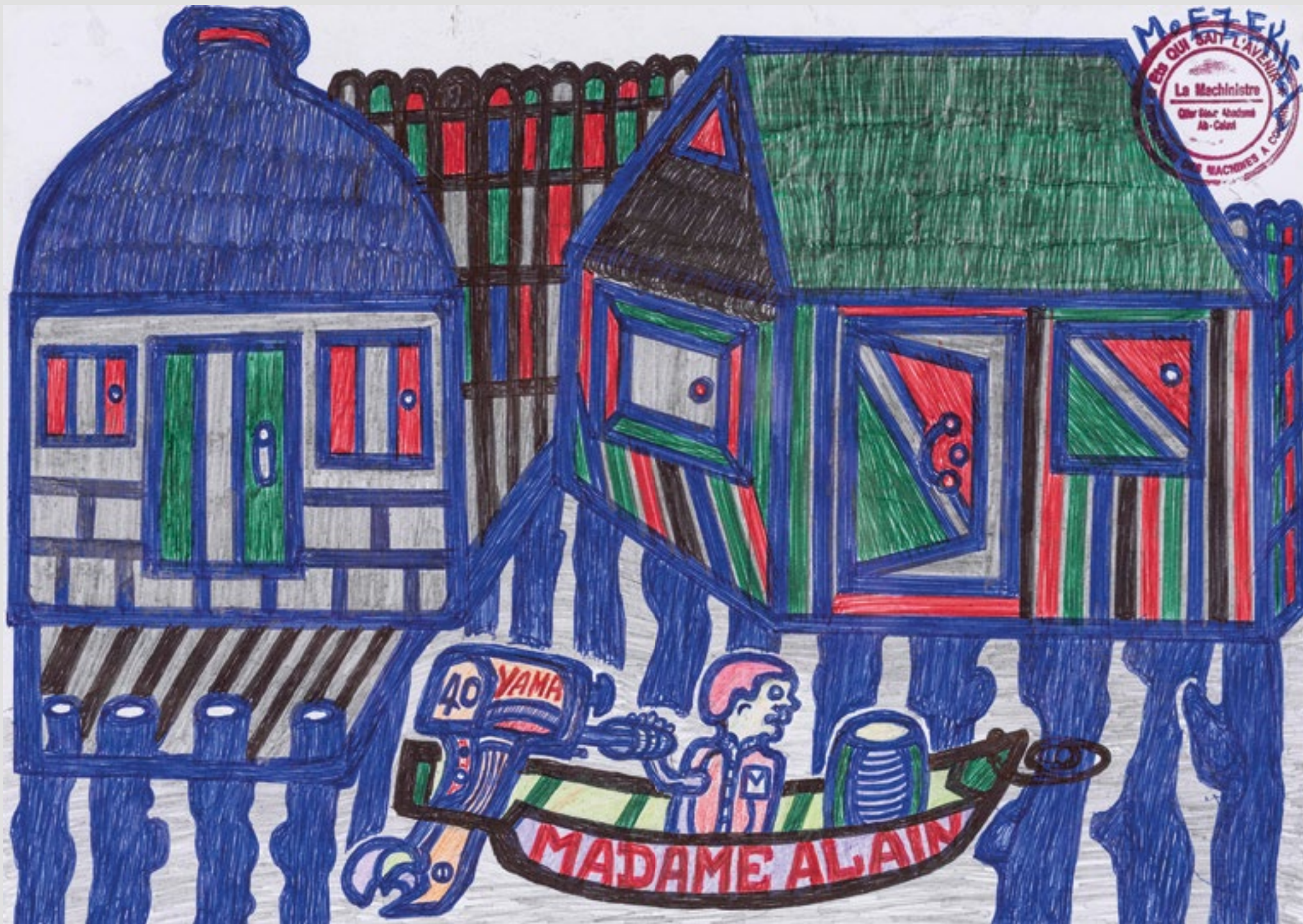
Sans titre (série Ganviè), Circa 2020. Mine graphite et stylo à bille sur papier, 21 x 29,5 cm.