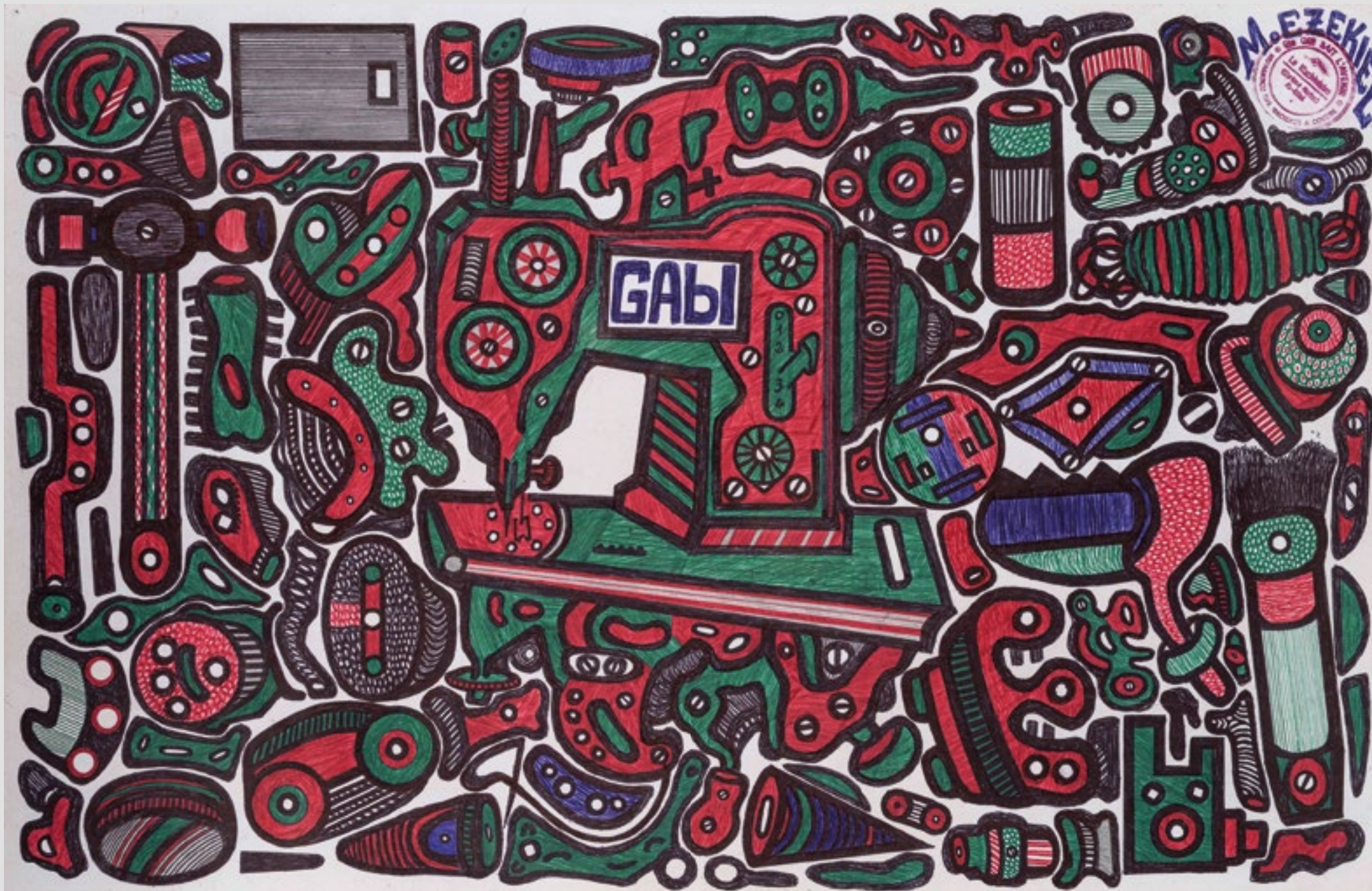
Sans titre (machine à coudre GABI), Circa 2020. Mine graphite et stylo à bille sur papier, 33 x 50 cm.