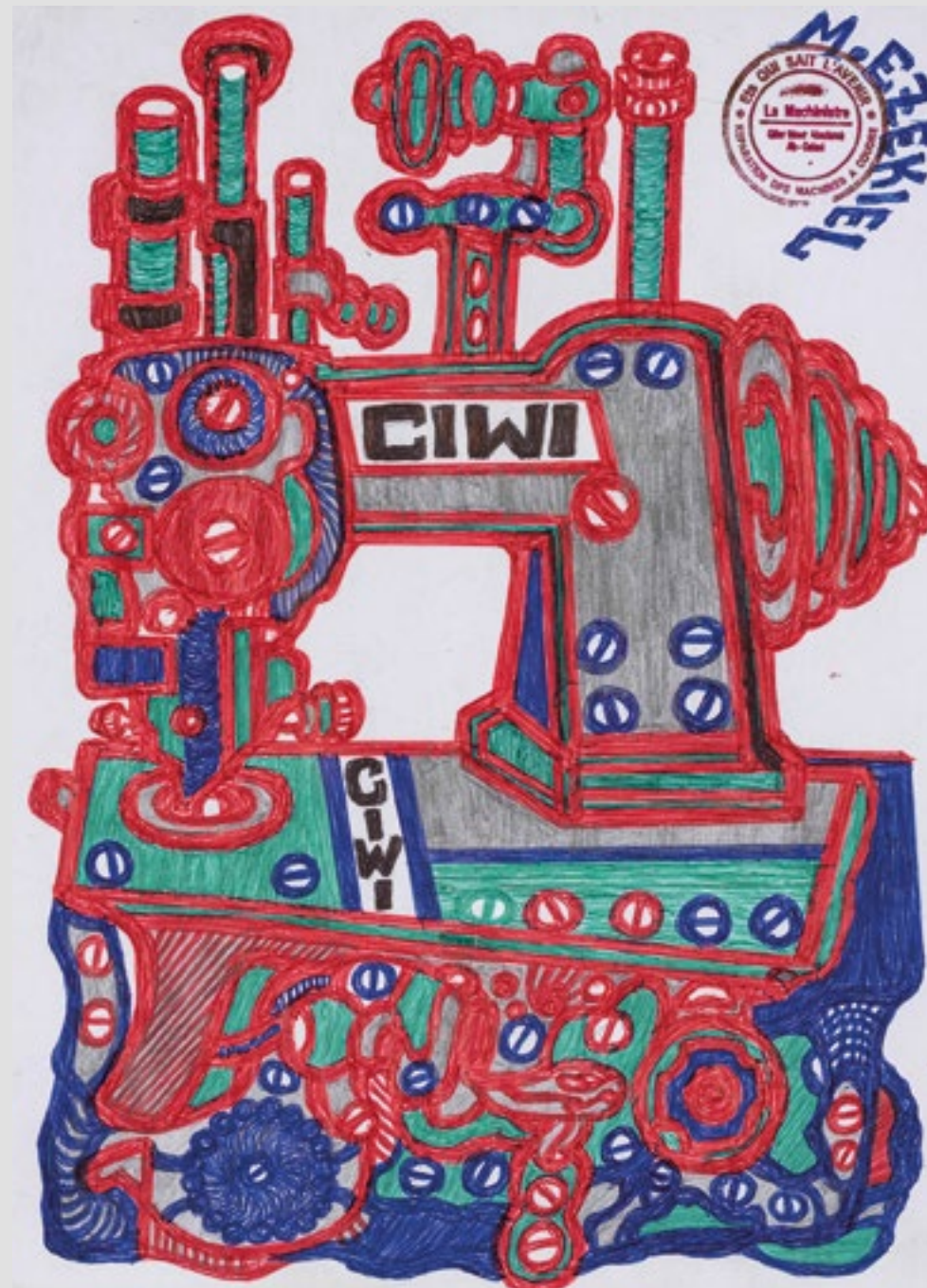
Sans titre (machine à coudre CIWI), Circa 2020. Mine graphite et stylo à bille sur papier, 29,5 x 21 cm.