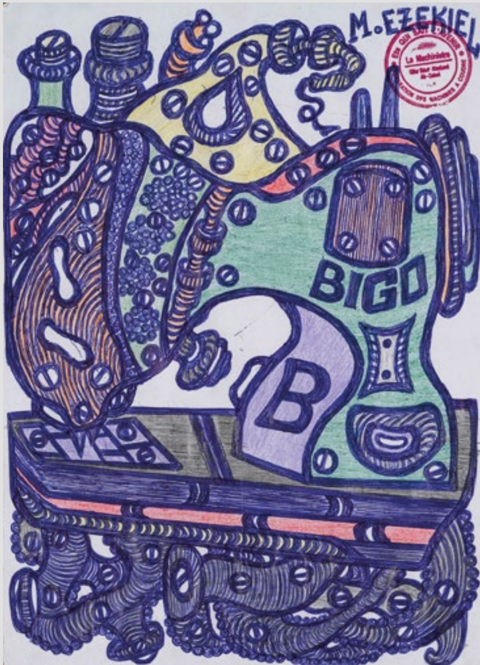
Sans titre (machine à coudre BIGO), Circa 2020. Mine graphite et stylo à bille sur papier, 29,5 x 21 cm.