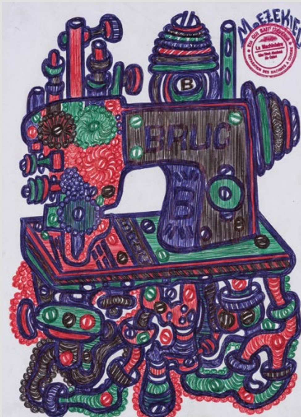
Sans titre (machine à coudre BRUC), Circa 2020. Mine graphite et stylo à bille sur papier, 29,5 x 21 cm.