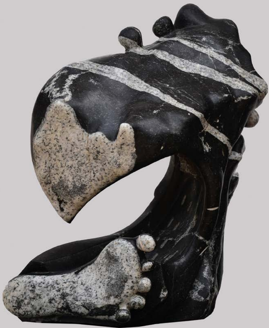
Tendance 1 granit 85 x 45 x 40 cm.