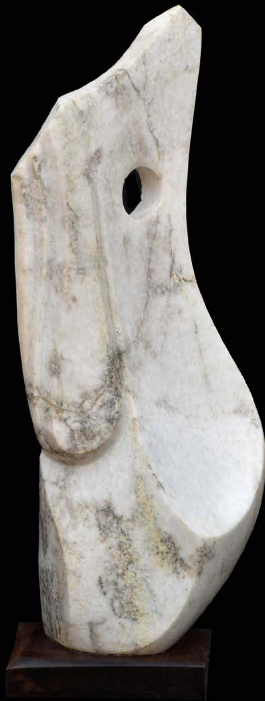
Tendance 2 granit 70 x 30 x 22 cm.