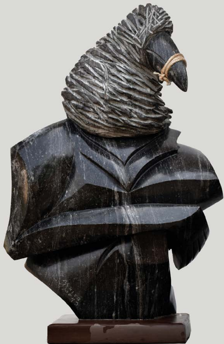
Hègbassamé 3 granit 75 x 55x 30 cm.