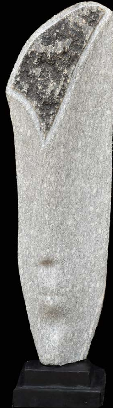
Noukpo granit 90 x 30 x 22 cm.