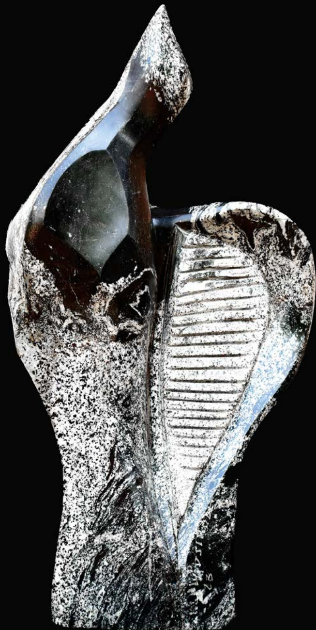
Hévi granit 80 x 40 x 42 cm.