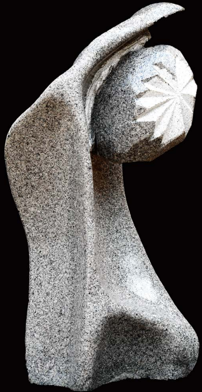
L'œil de l'océan granit 76 x 40 x 33 cm.