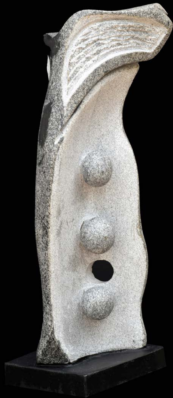
Sans titre granit 65 x 25 x 20 cm.