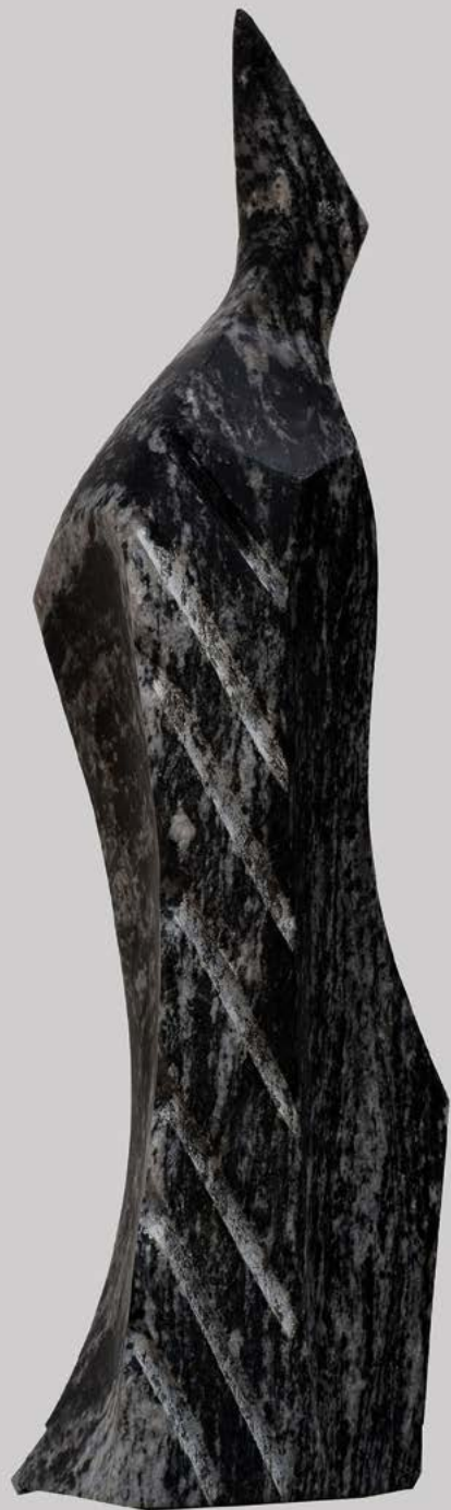
Hévi 6 granit 54 x 14 x 17 cm.