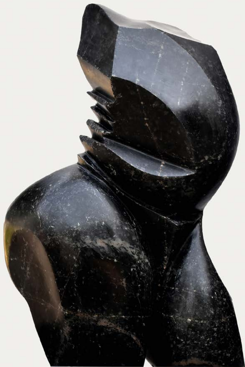
Dejéliba granit 50 x 30 x 30 cm.