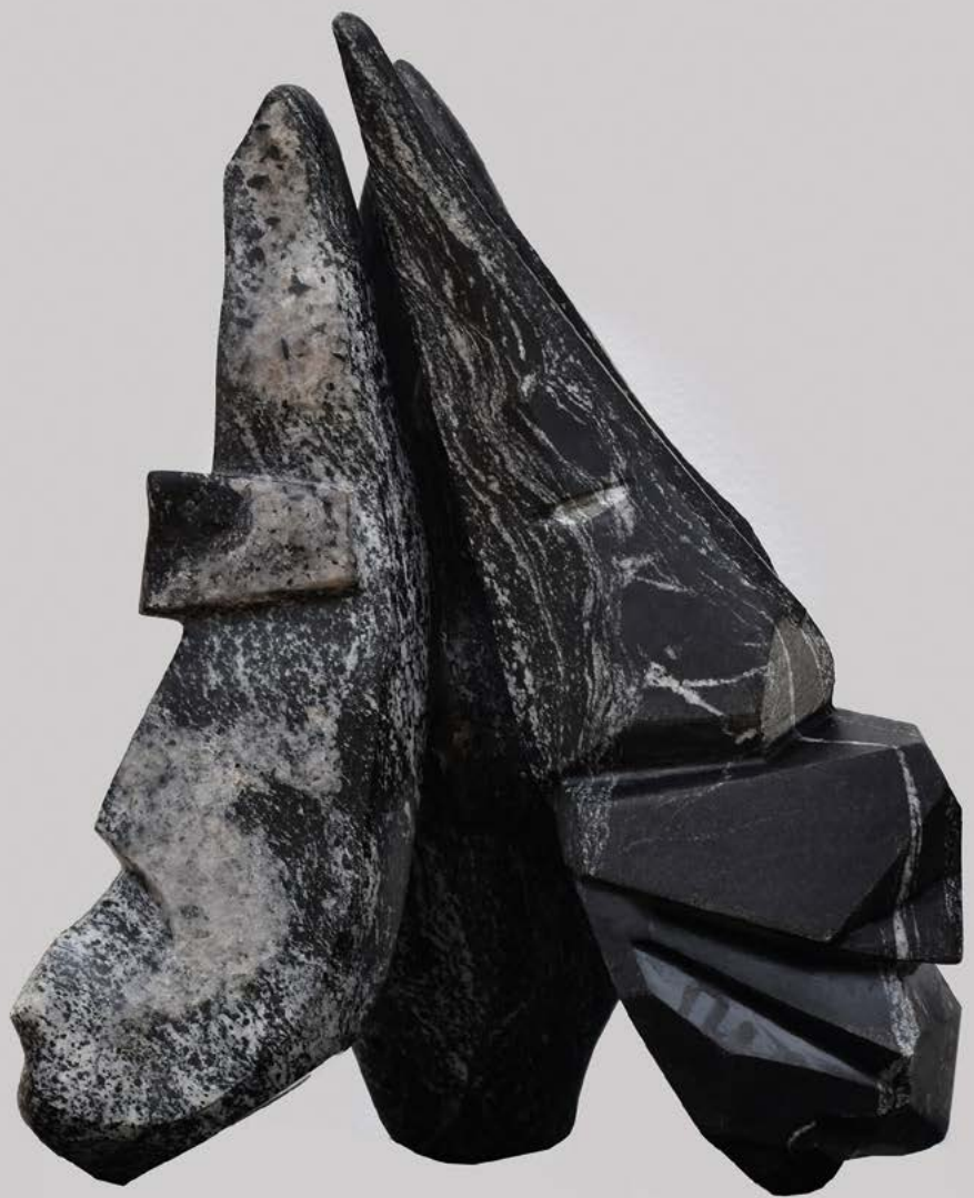
Les trois princes 3 granit 53 x 40 x 43 cm.