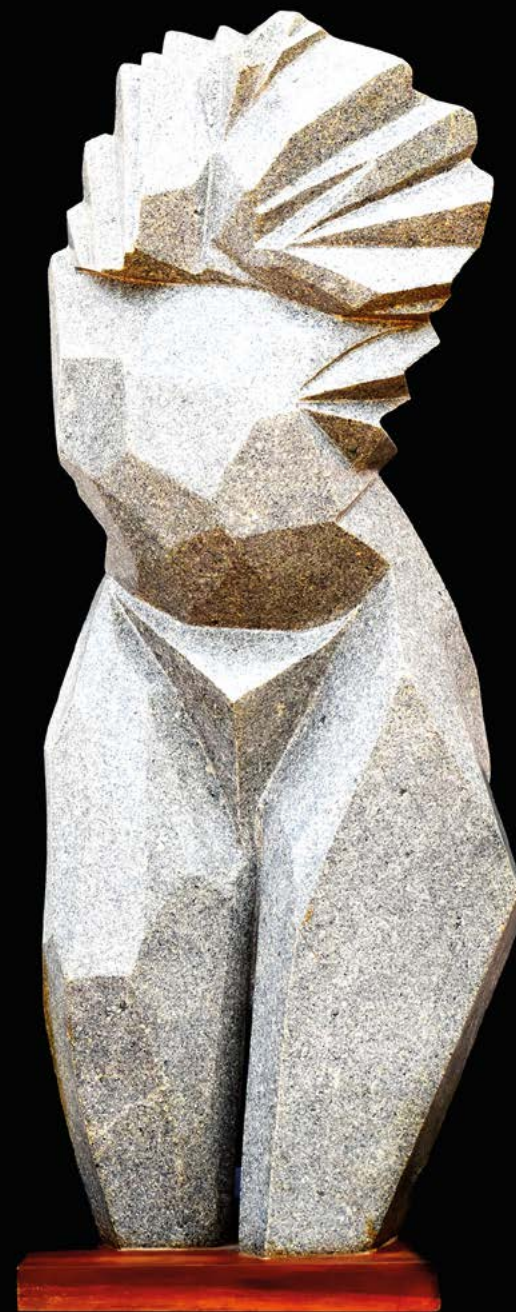
Agbonnon granit 105 x 40 x 35 cm.