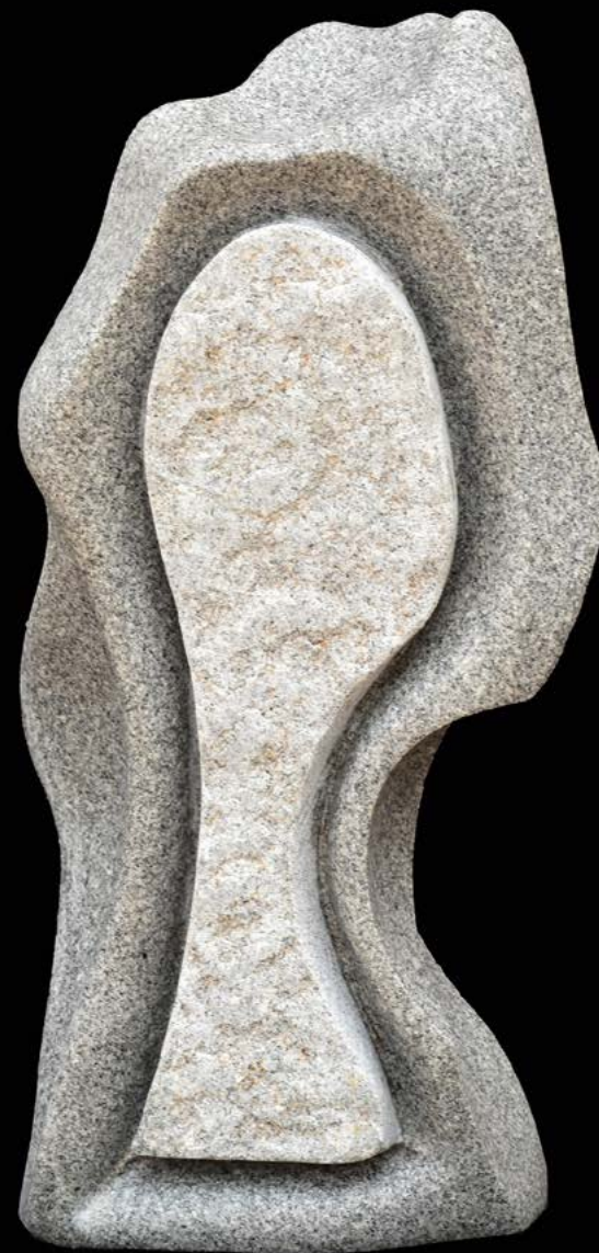
Sans titre granit et métal 64 x 40 x 25 cm.