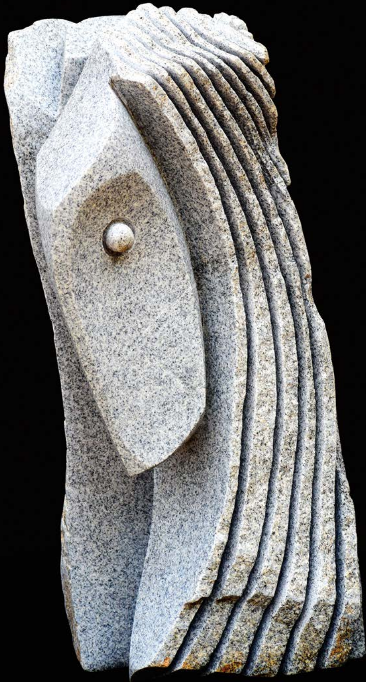
L'écoute granit 58 x 28 x 26 cm.