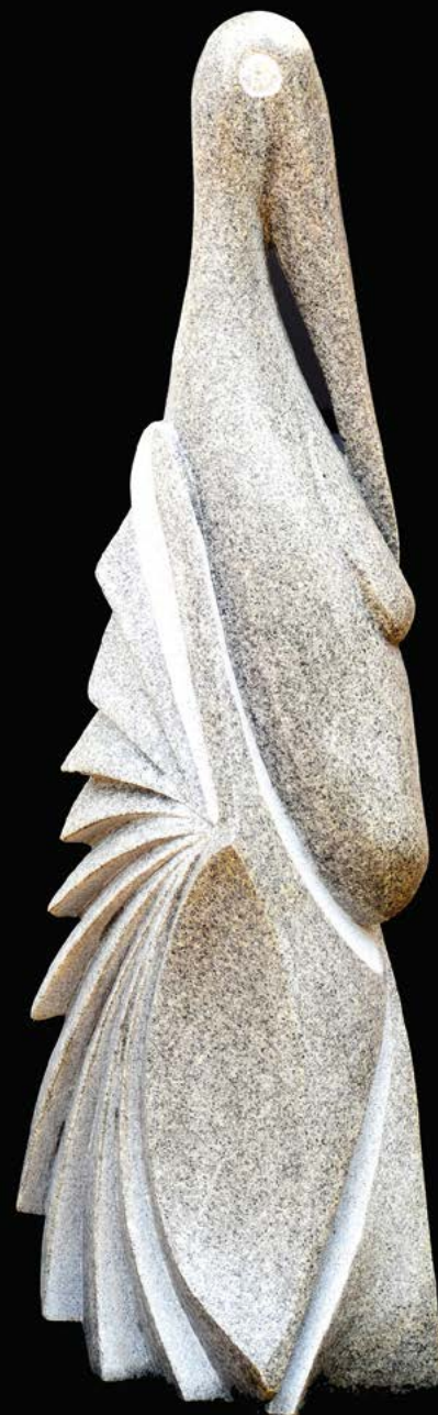
Hévi 4 granit 112 x 44 x 30 cm.