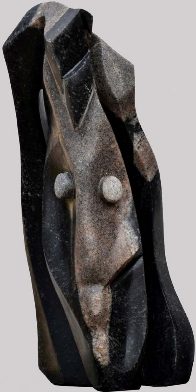
Mes deux faces 2 granit 60 x 30 x 22 cm.