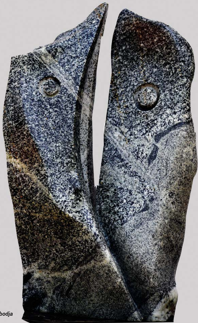
Tété et Gbodja granit 66 x 43 x 33 cm.