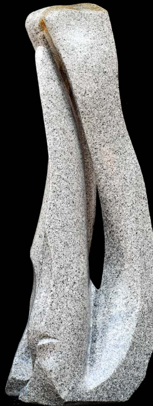
Je sors de la pierre 3 granit 88 x 30 x 30 cm.