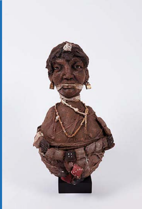
Sans titre , 2015. Technique mixte, 63 x 36 x 40 cm.