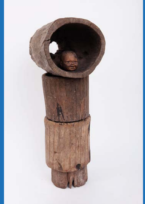
Moine , 2012. Bois et poupées de plastique, 97 x 34 x 36 cm.