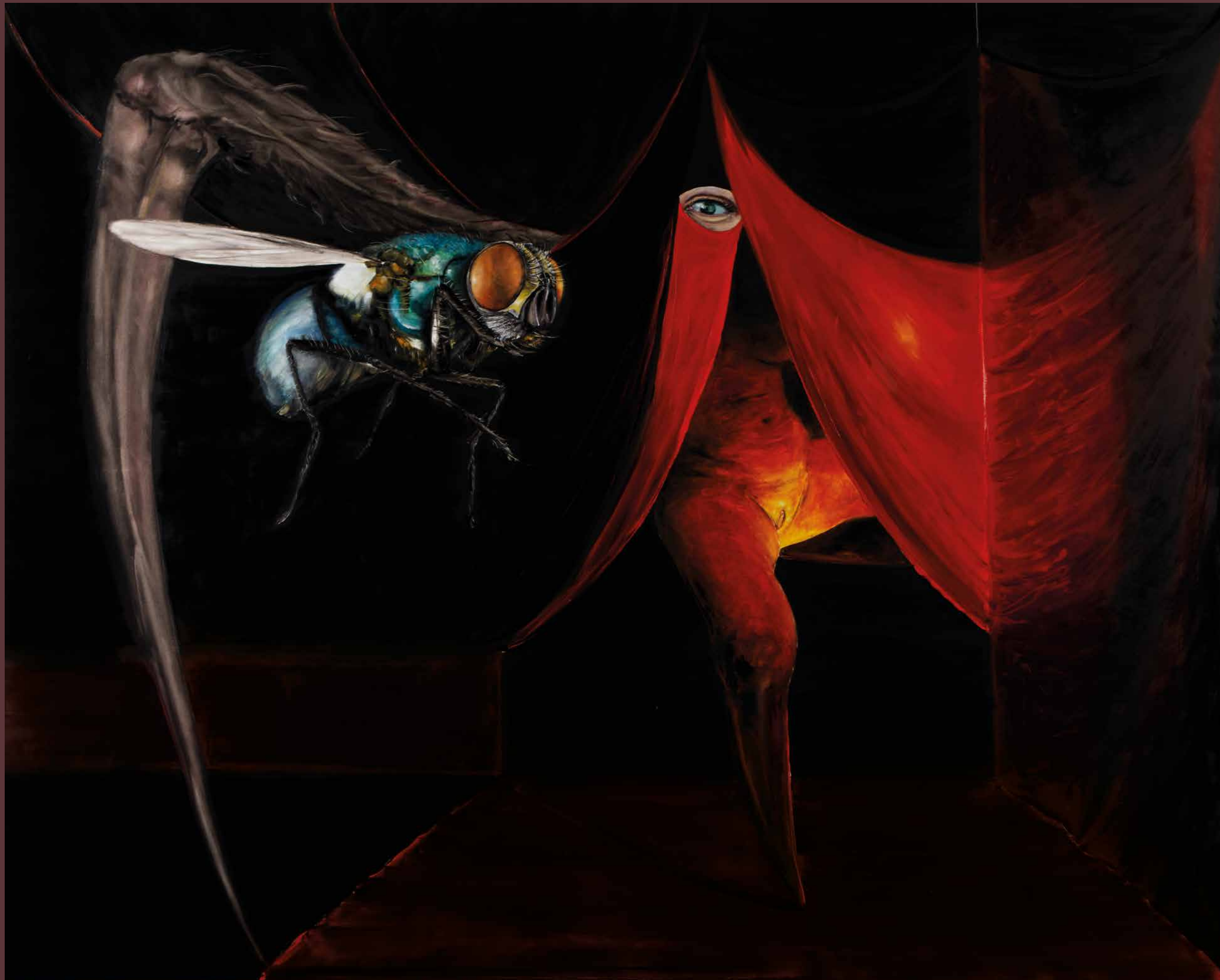
La mouche , 2020. Huile sur toile, 160 x 200 cm.