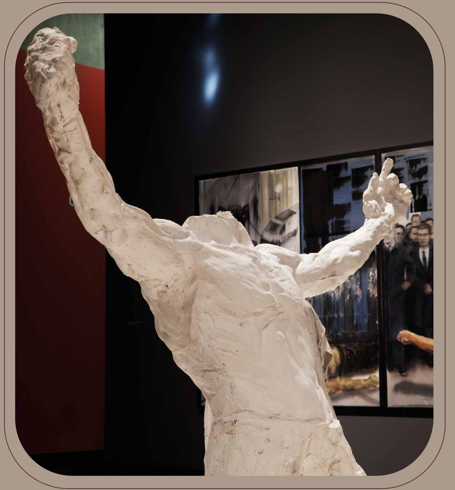
Page de gauche : Primitive burden , 2020. Bronze et acier, pièce unique, 85 x 37 x 25 cm.