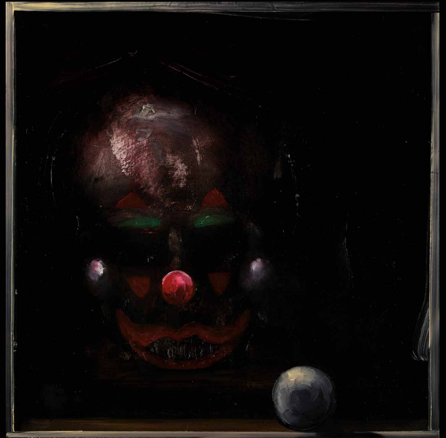
Clown 3, 2020. Huile sur bois, 40 x 40 cm.