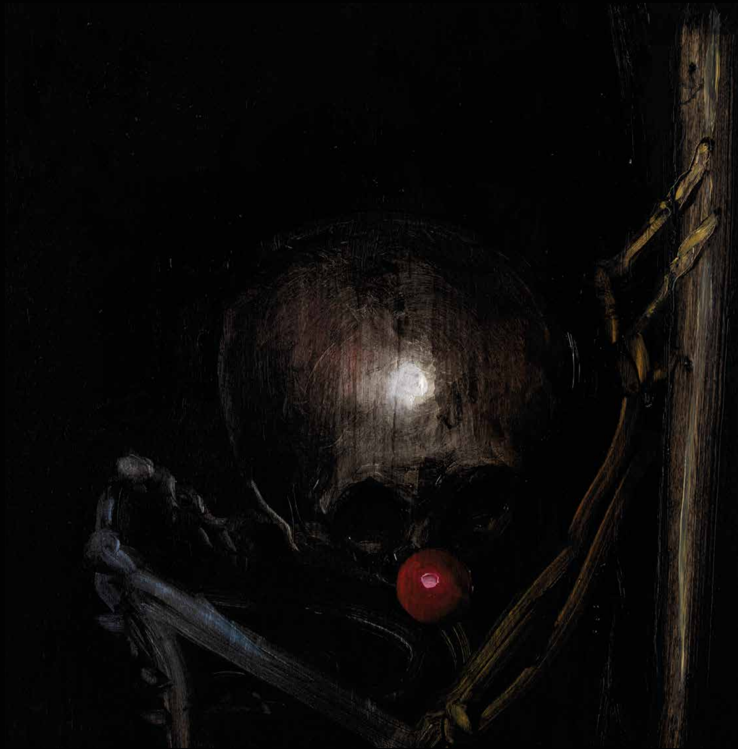
Clown 1, 2020. Huile sur bois, 40 x 40 cm.