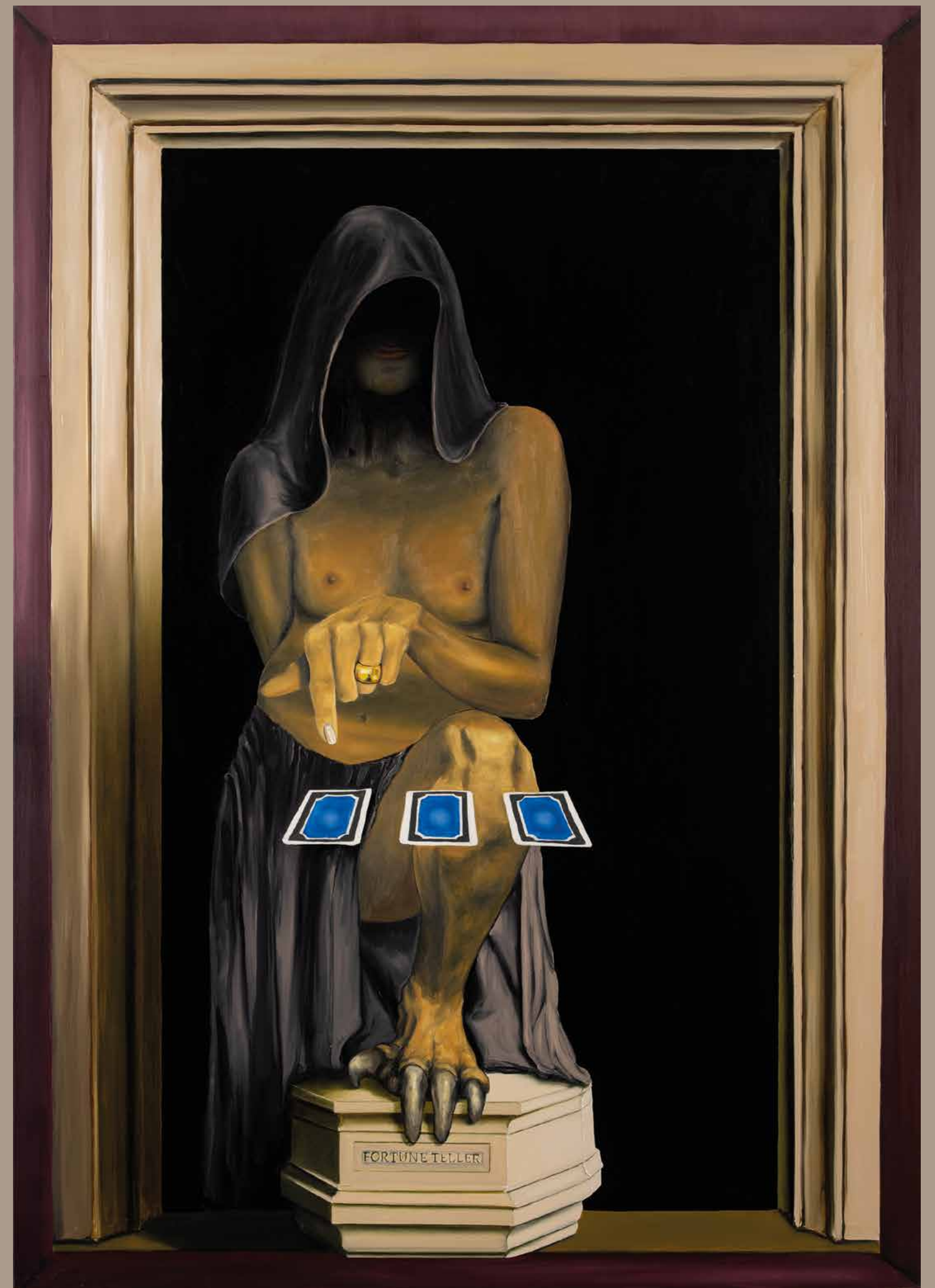
Fortune teller, 2020. Huile sur toile, 162 x 114 cm.