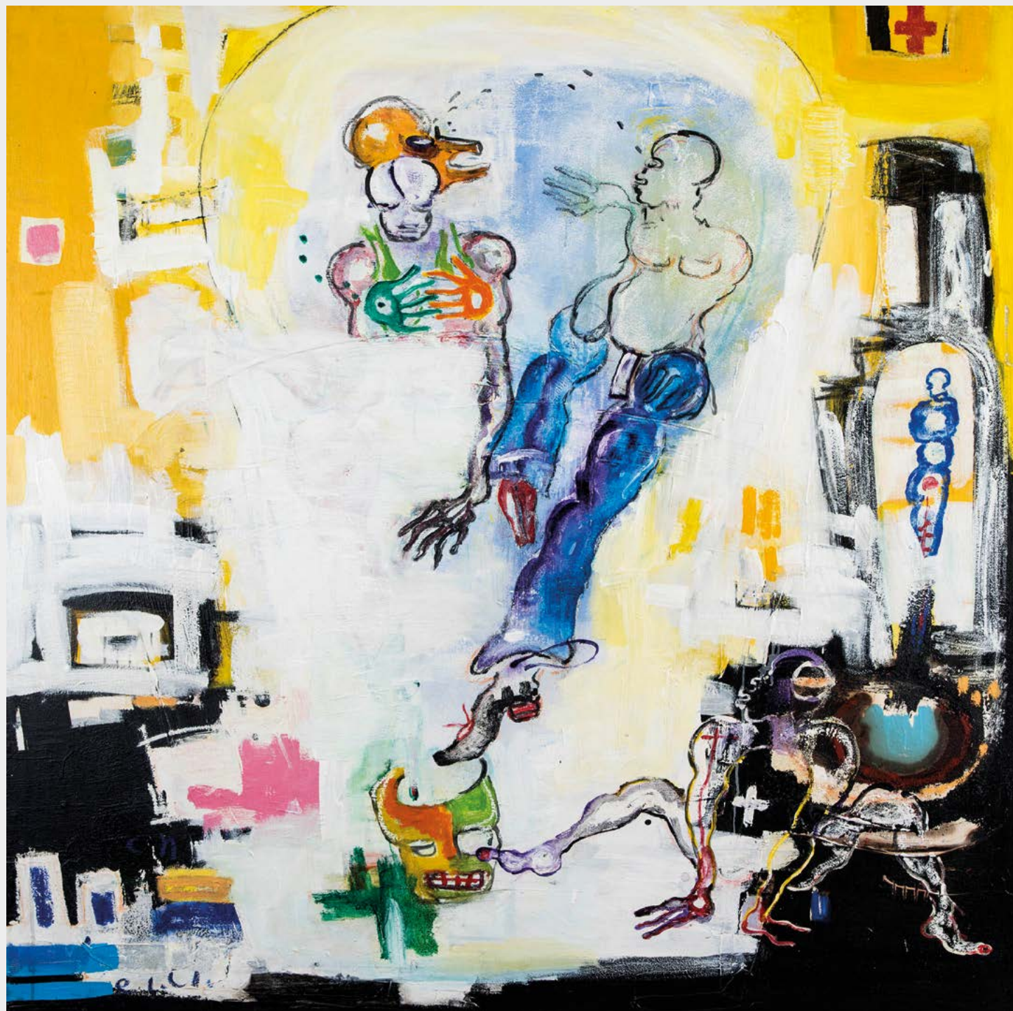
Dominique Zinkpè, Belle Fontaine , 2021. Pastel gras et acrylique sur toile, 150 x 150 cm.