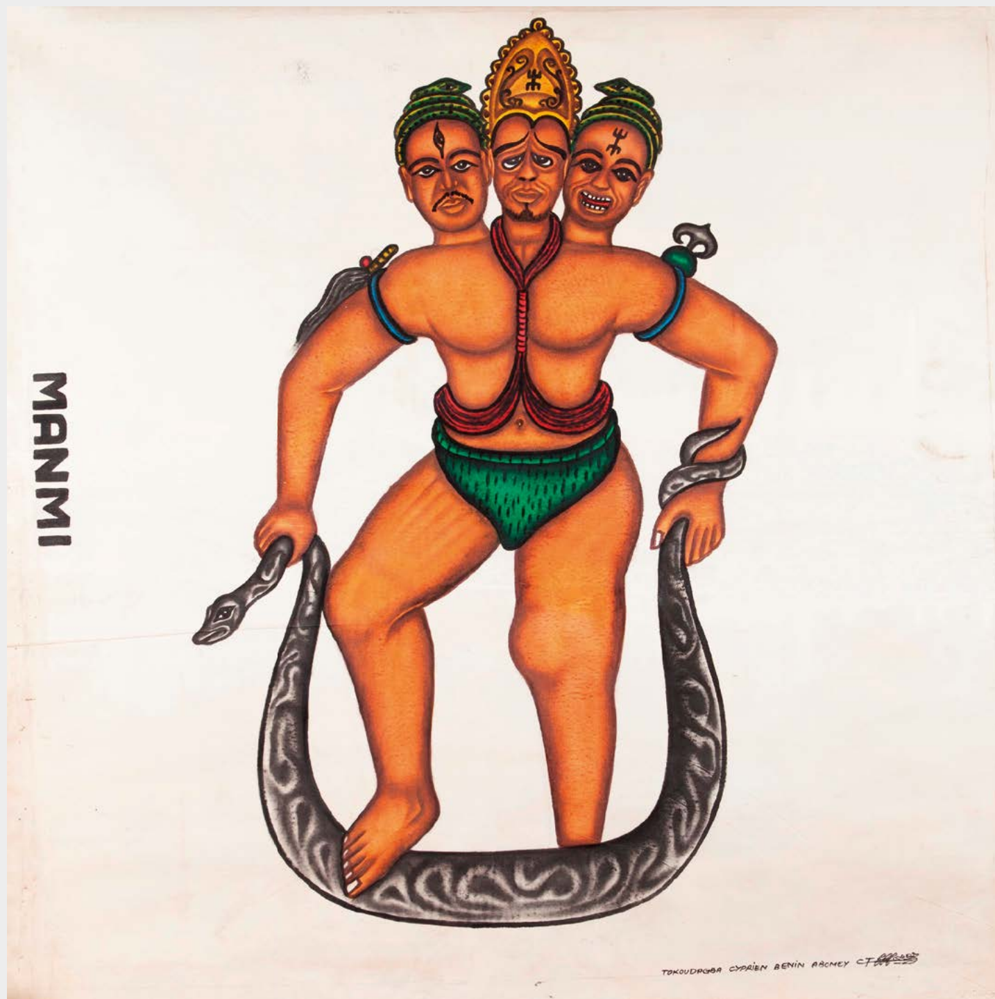
Cyprien Tokoudagba, Manmi . Technique mixte sur toile, 136 x 130 cm.

Cyprien Tokoudagba a été exposé dans presque tous les pays d'Europe occidentale, aux États-Unis, au Japon, au Mexique, au Brésil et a été présent dans la plupart des grandes biennales.