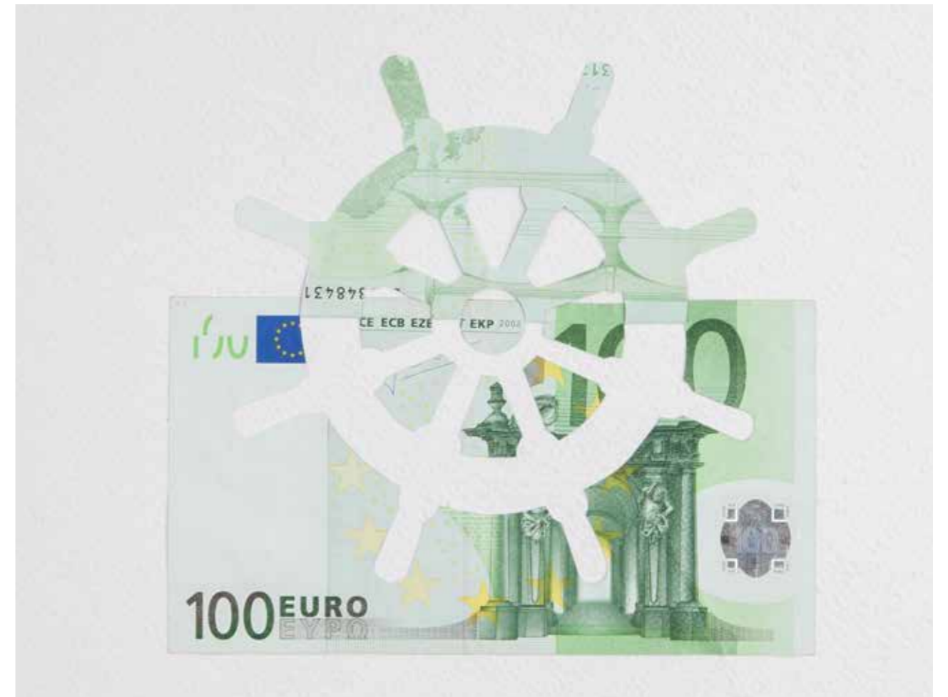
100°N • 2016 Billet de 100 euros (2002, en circulation) sur papier 35 x 50 cm