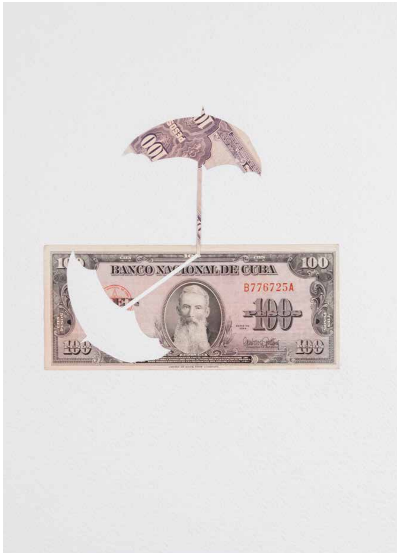
Sombra (Ombre) • 2016 Billet de 100 pesos cubains (1954, hors cours) sur papier 35 x 40 cm