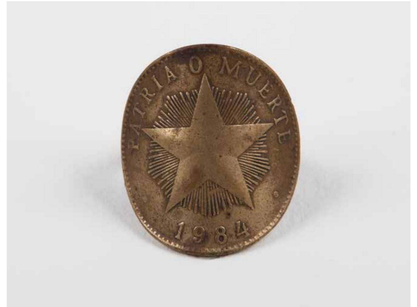
Compromiso (Compromis) • 2003 Anneau et pièce de 1 peso cubain (1984, en circulation) 20 x 26 cm (avec le cadre)