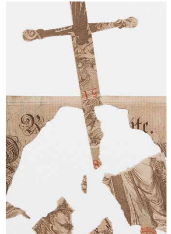
Excalibur • 2016 Billet de 1.000 marks allemands (1912, hors cours) sur papier 35 x 50 cm