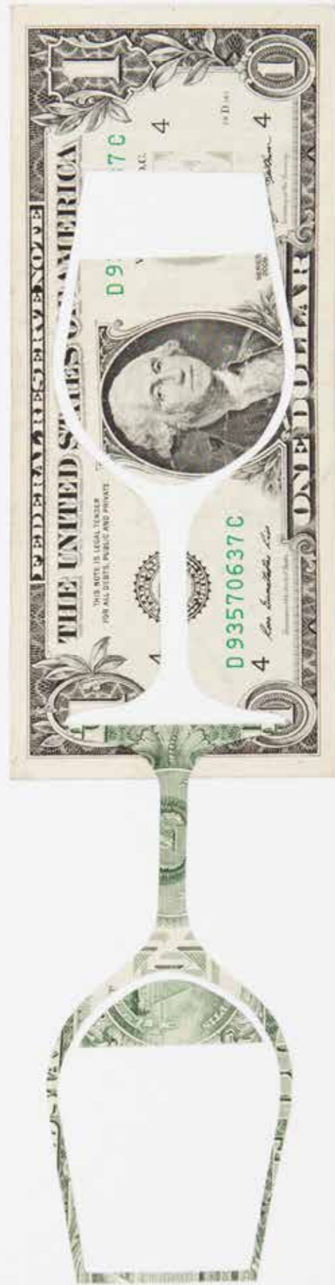
Copa (Verre) • 2016 Billet de 1 dollar américain (2009, en circulation) sur papier 50 x 25 cm