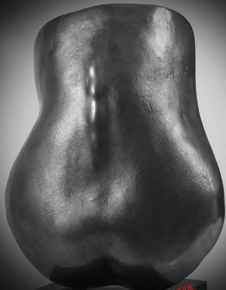
6 / DOS SCULPTURE EN BRONZE DORÉ SUR SOCLE MÉTALLIQUE, 1966, signée, n°5/6, H. 41 x L. 32 x P. 10 cm