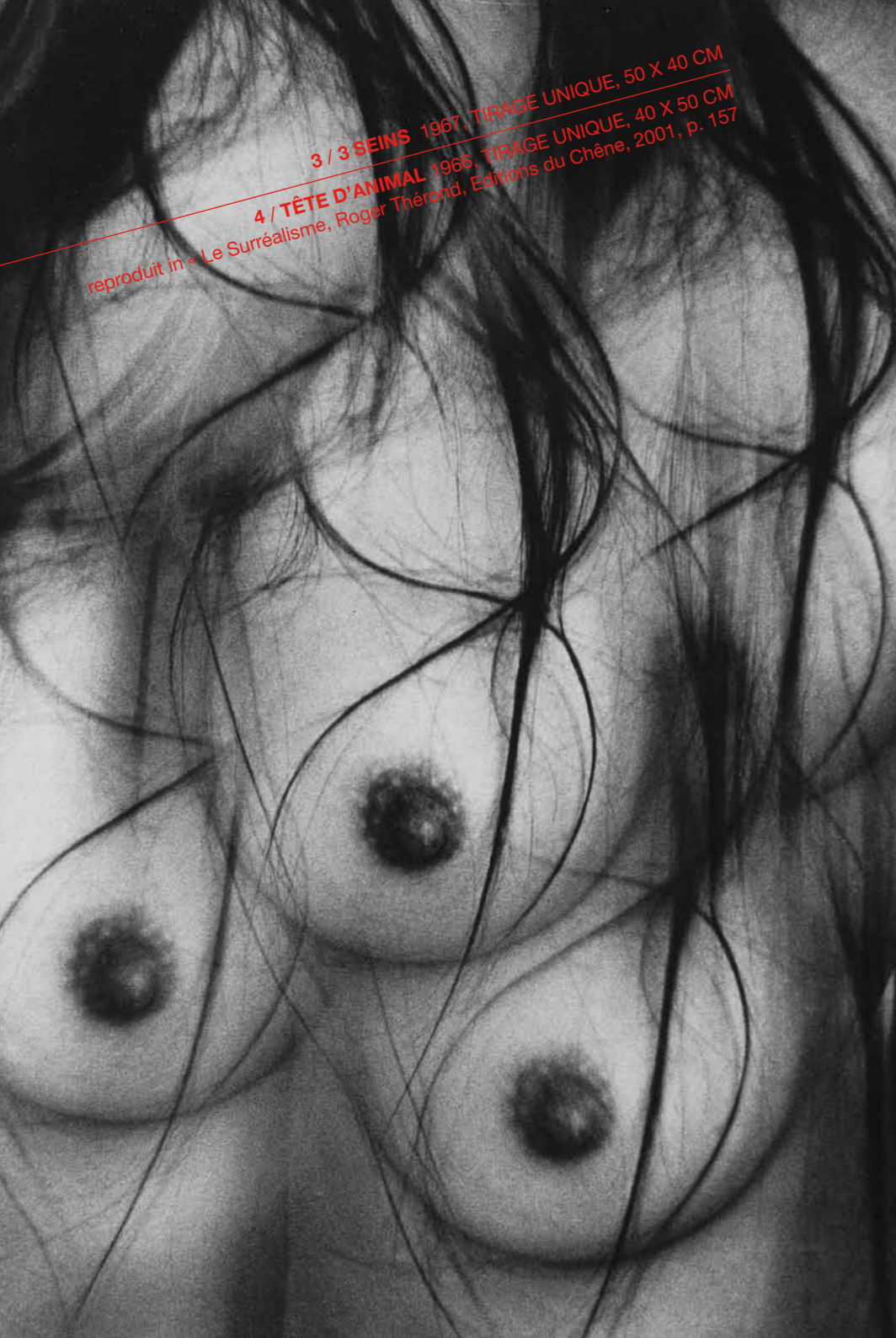
3 / 3 SEINS 1967, TIRAGE UNIQUE, 50 X 40 CM