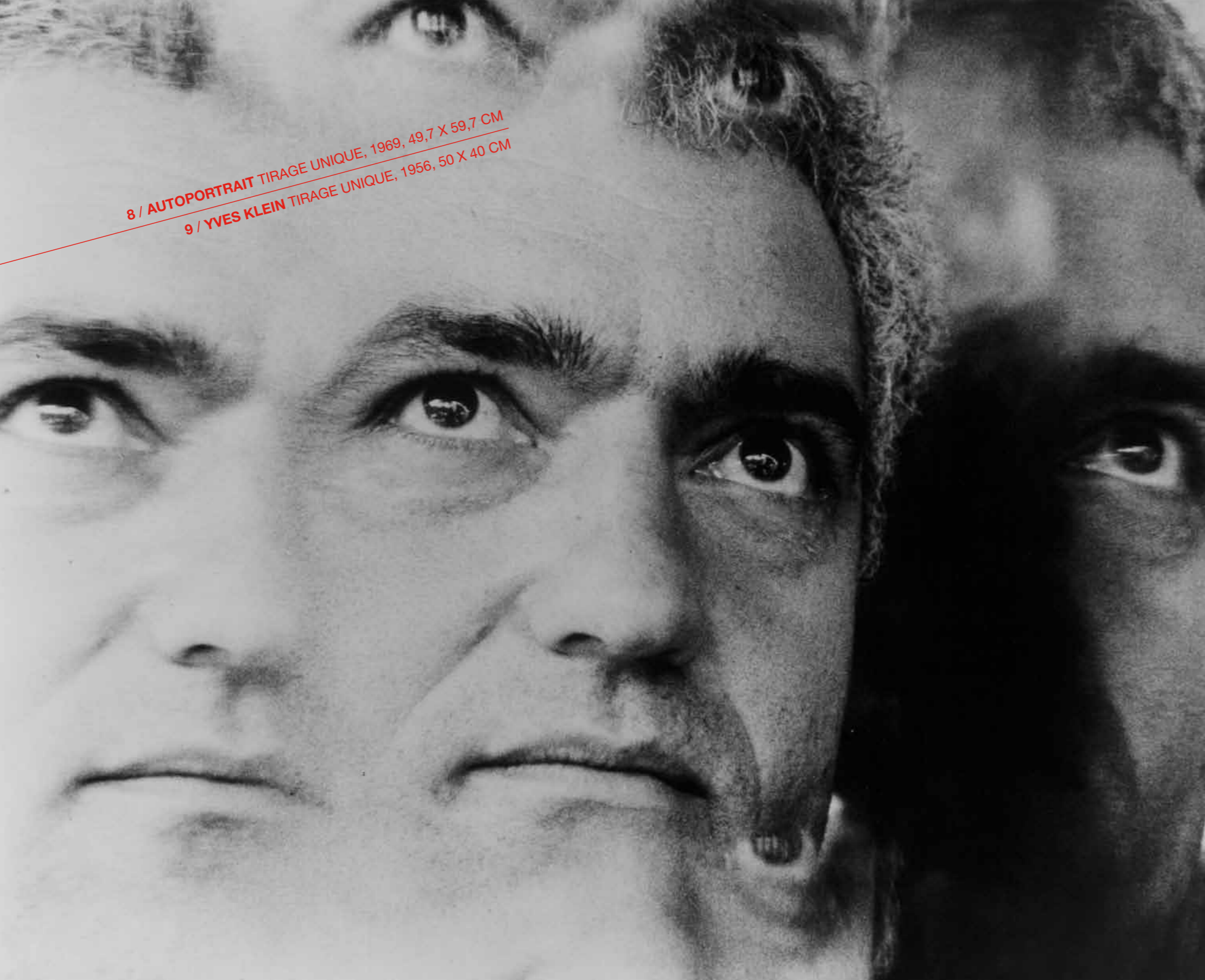
8 / AUTO PORTRAIT TIRAGE UNIQUE, 1969, 49,7 X 59,7 CM