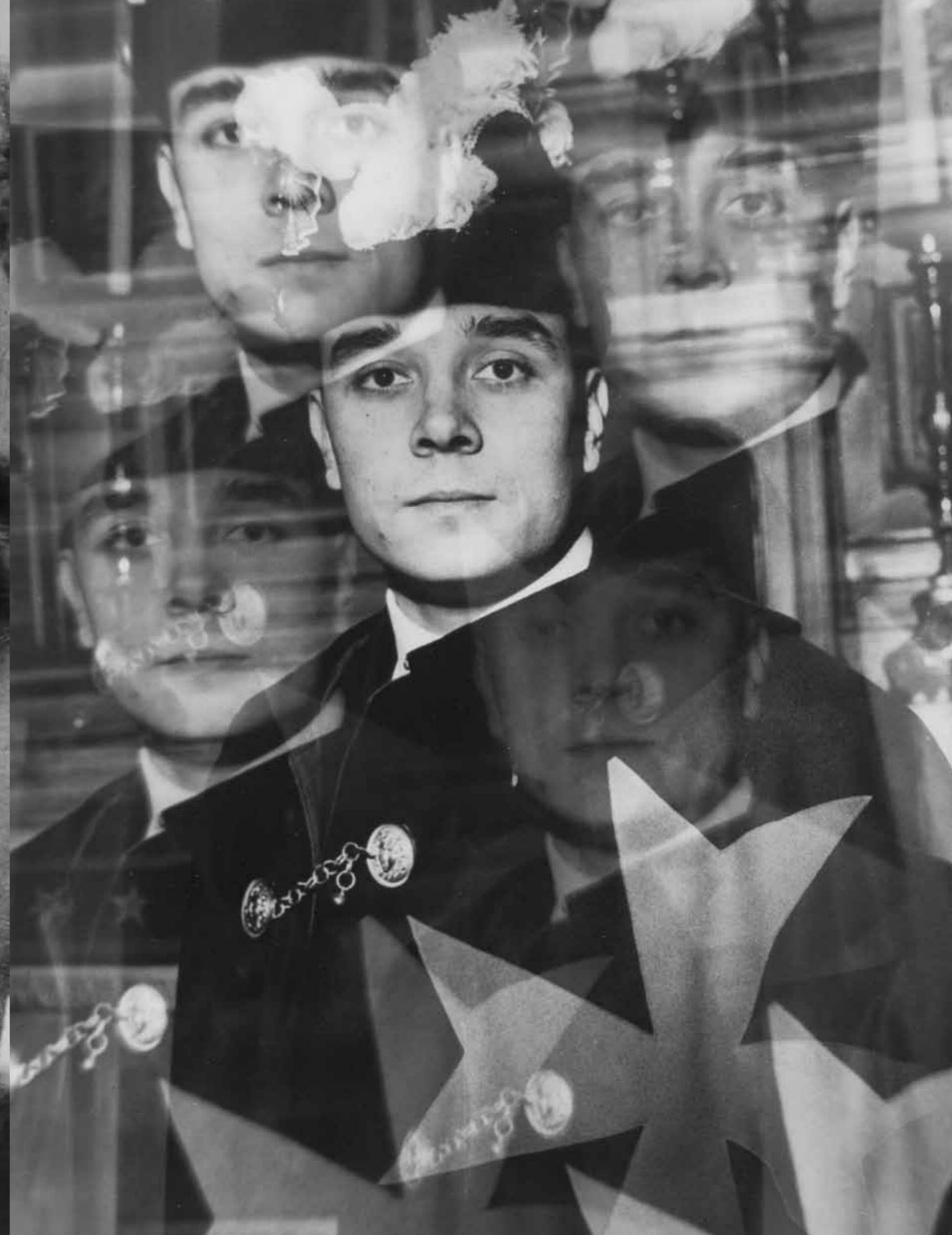
9 / YVES KLEIN TIRAGE UNIQUE, 1956, 50 X 40 CM