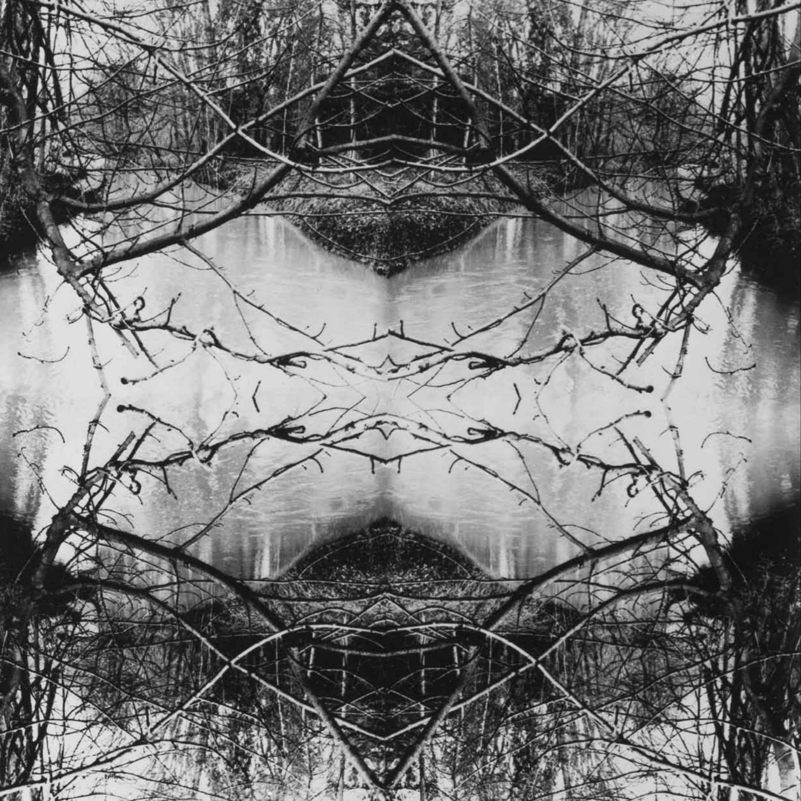
11 / ETOILE DE DAVID 1966, TIRAGE UNIQUE, 50 X 40 CM