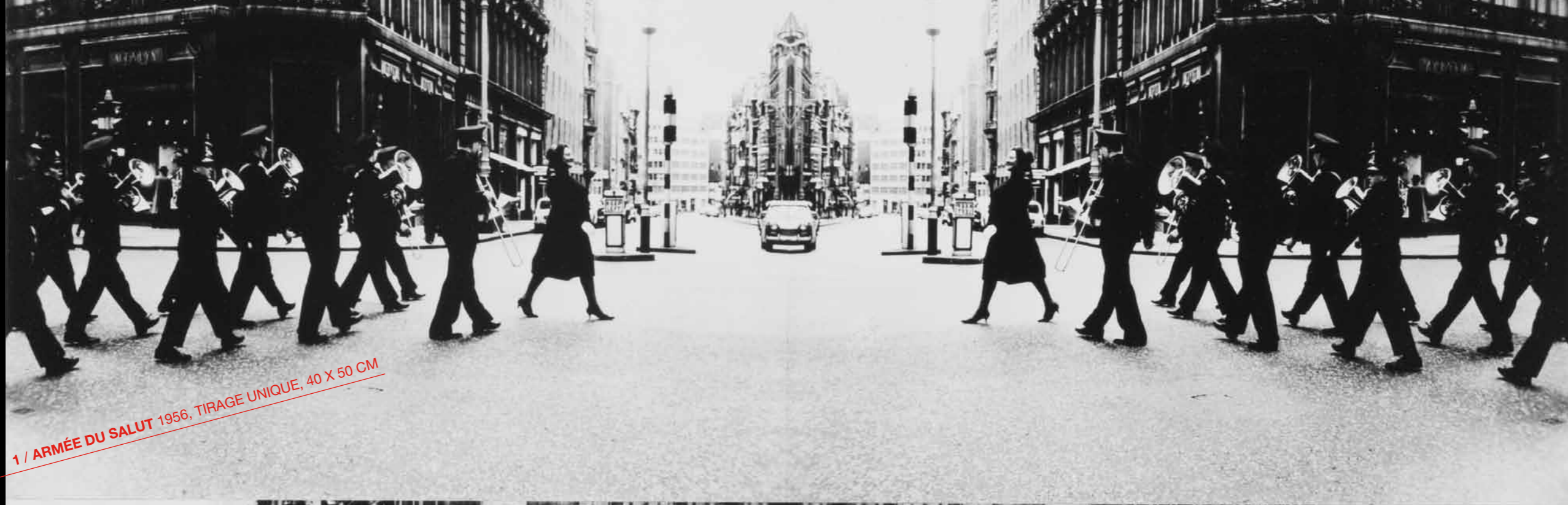
1 / ARMÉE DU SALUT 1956, TIRAGE UNIQUE, 40 X 50 CM