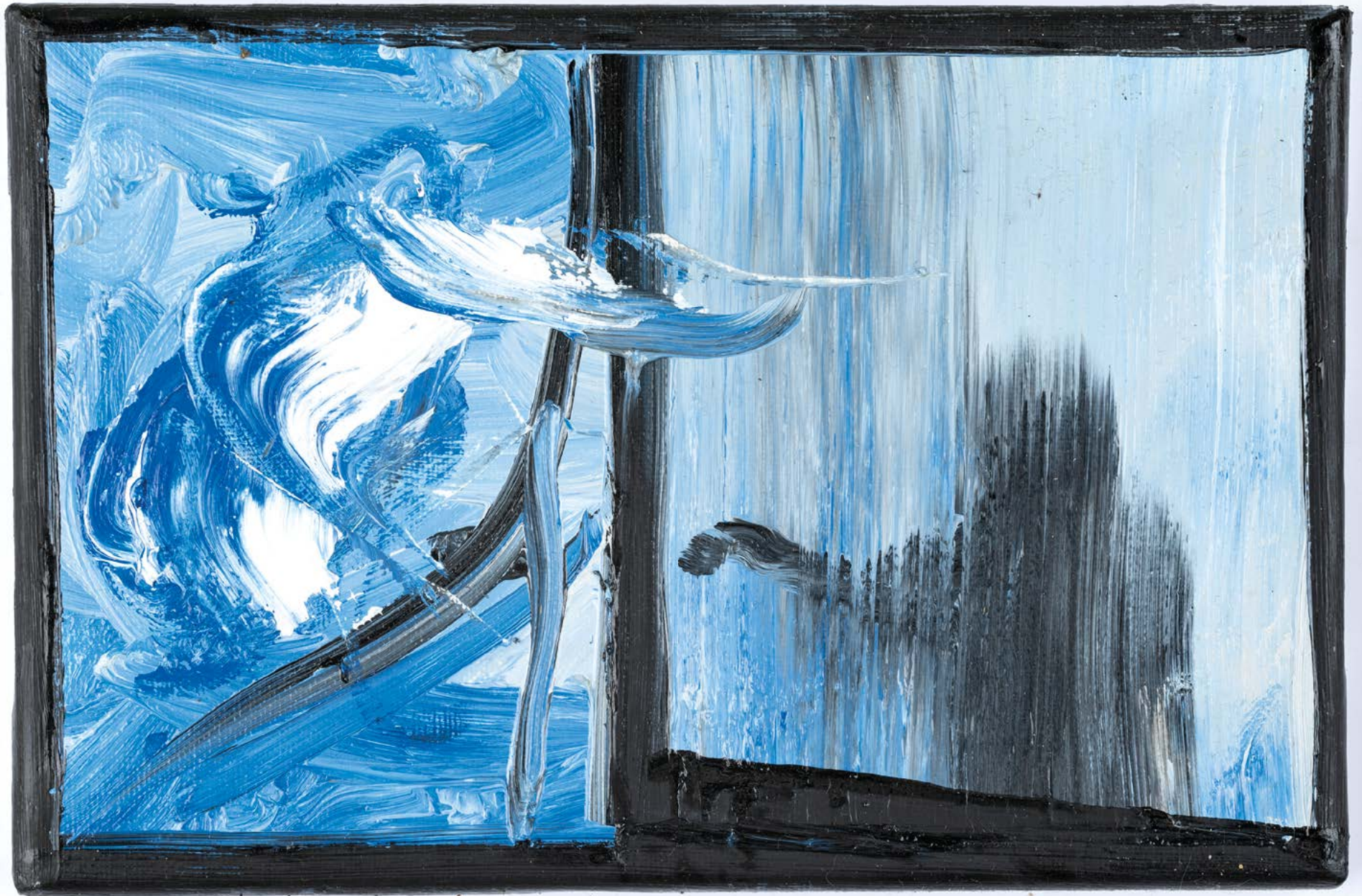
Sans titre , 2022. Huile sur toile, 16 x 24 cm.