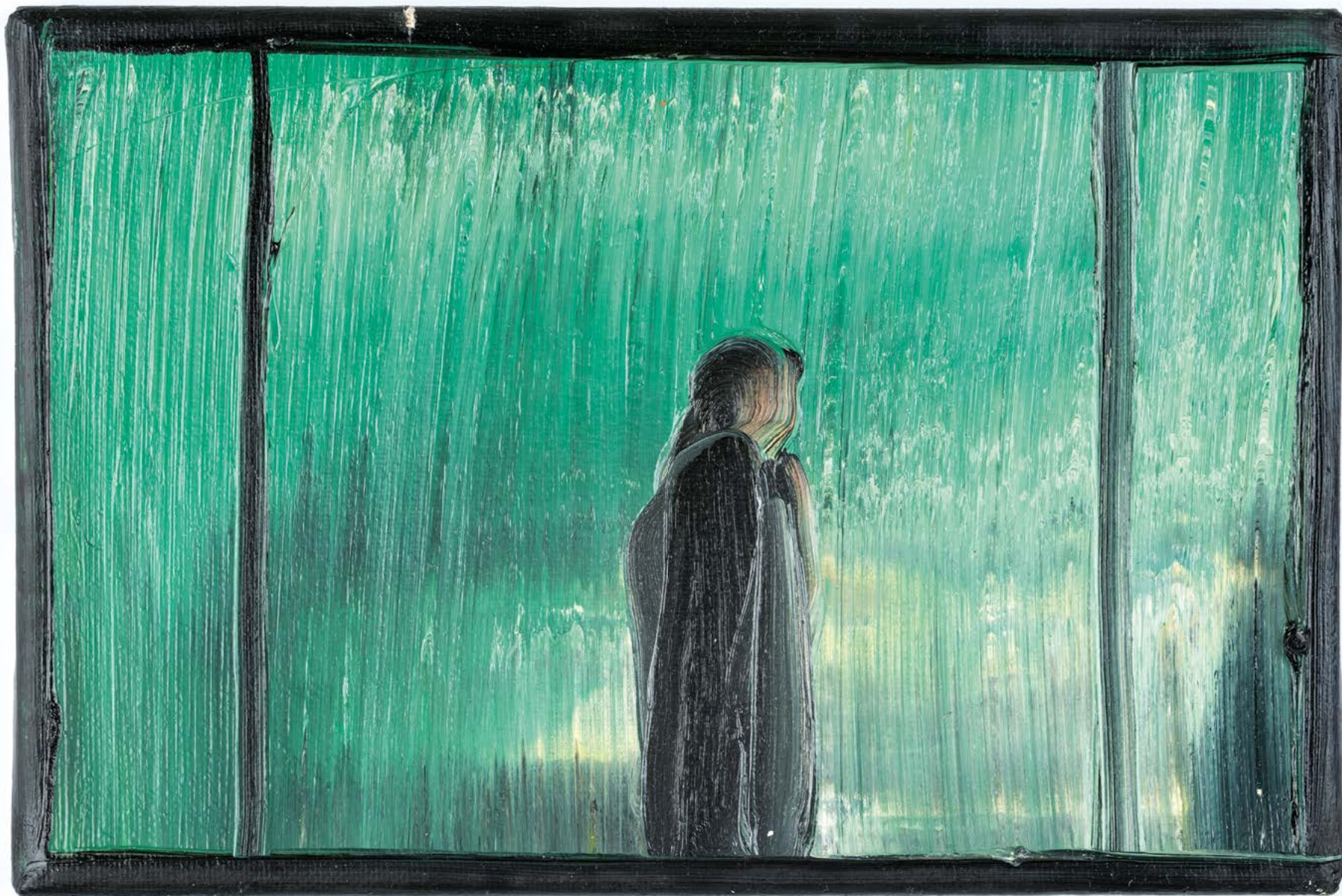
Sans titre , 2022. Huile sur toile, 16 x 24 cm.