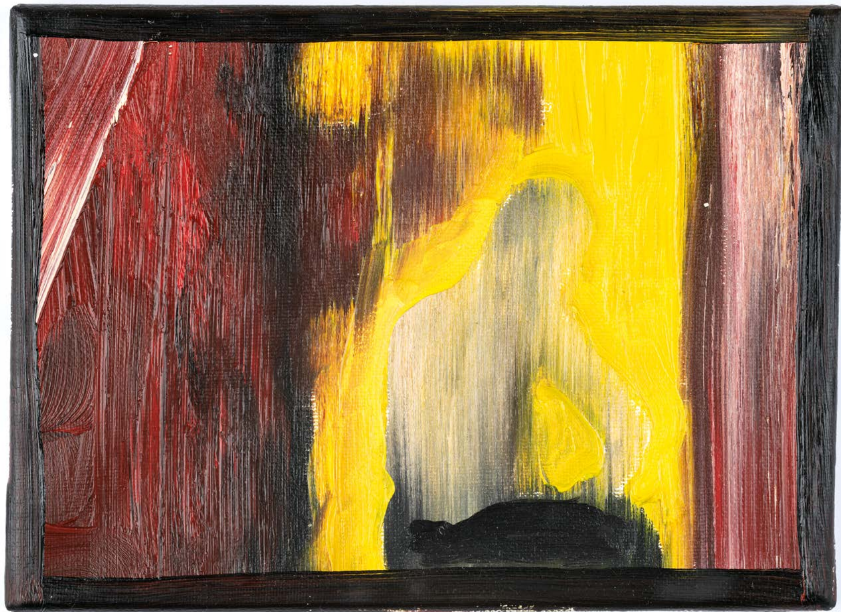
Sans titre , 2022. Huile sur toile, 16 x 24 cm.