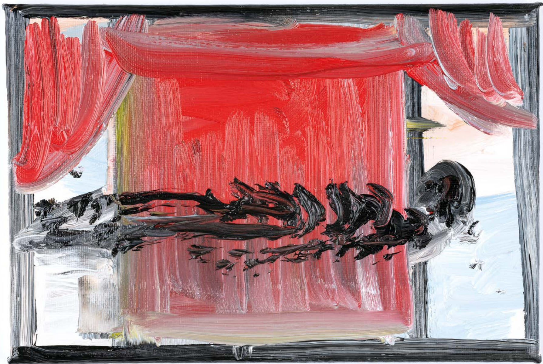
Sans titre , 2022. Huile sur toile, 16 x 24 cm.