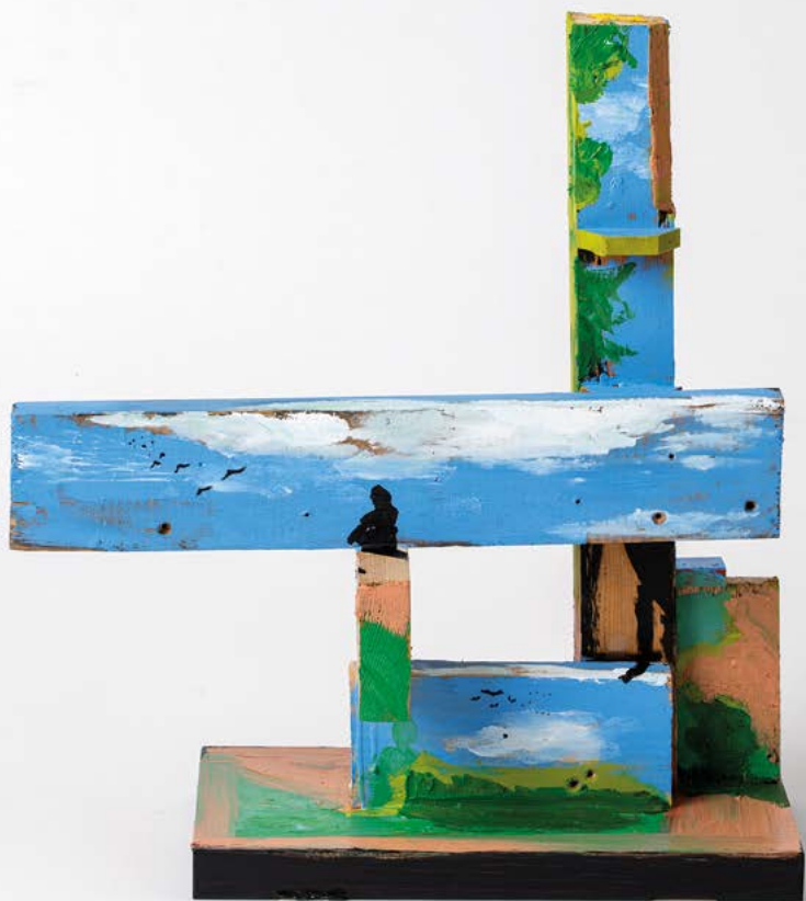
Sans titre , 2022. Huile sur bois, 42 x 42 x 16 cm.