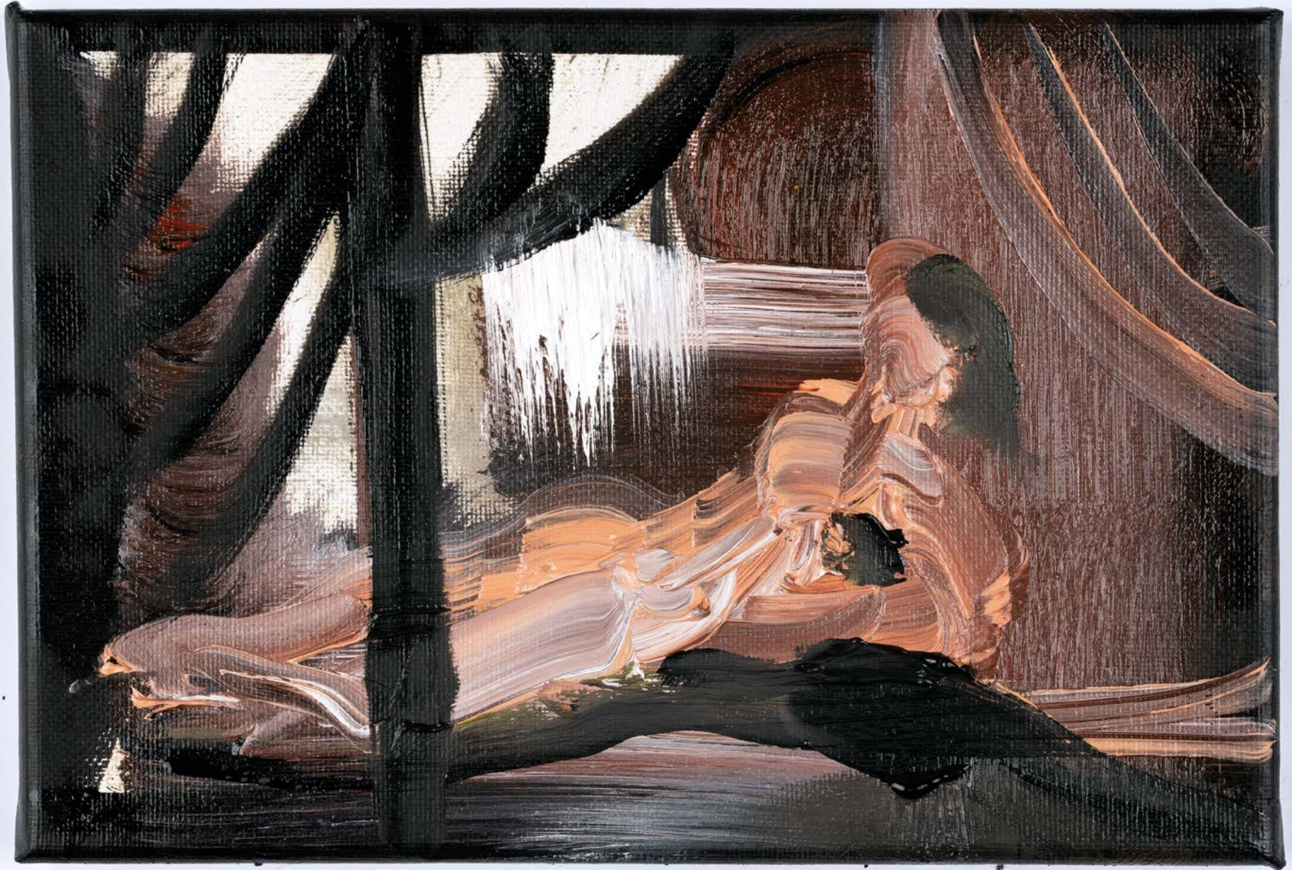
Sans titre , 2022. Huile sur toile, 16 x 24 cm.